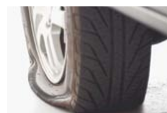
Накручиваете ниппель обратно и накачиваете колесо. После этого