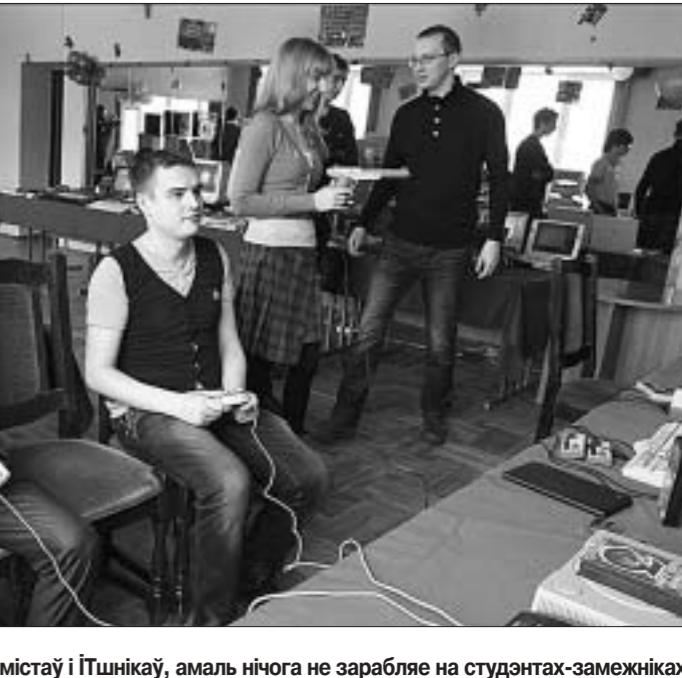
Нават БДУІР, які рытуе праграмістаў і ІТшнікаў, амаль нічога не зарабляе на студэнтах-замежніках...

Больш за ўсё ў Беларусі навуцацца студэнтаў з Кітая — 37% з агульнай колькасці студэнтаў-замежнікаў. З Туркменістана — 25%, з Расіі — 13,7%. Усяго толькі 3% студэнтаў-замежнікаў — жыхары Казахстана. Яшчэ менш навуцацца ў нашых ВНУ украінцаў, маладван і лійоўцаў. Толькі некалькі грамадзян Германіі, Іспаніі, Нарвегіі, Польшчы, Славеніі, Фінляндыі і Швецыі навуцаюцца ў Беларускім дзяржаўным універсітэце.