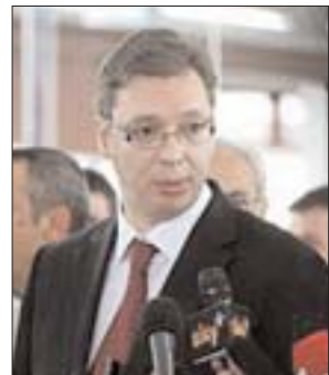
Местные независимые аналитики опасаются, что Сербия может попасть под абсолютную власть авторитарного лидера Сербской прогрессивной партии Александра Вучича (на фото).