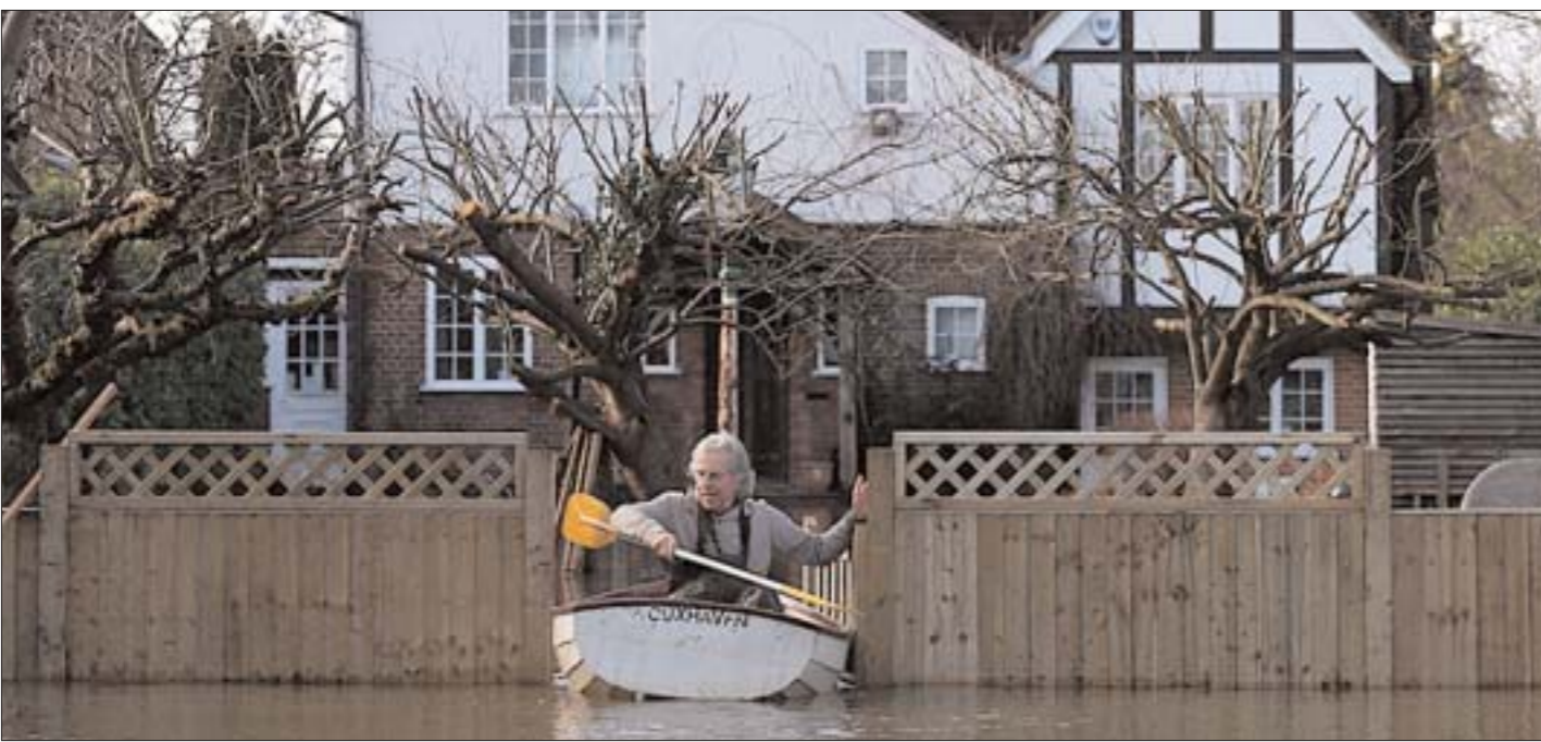
Надвор'е: штосьці не так!

Гэты брытанец, як і тысячы яго суайчыннікаў, вымушаны пакінуць свой дом, ратуючыся ад паводкі пасля таго, як Тэмза выйшла з берагоў. Такія паводкі здарыліся і ў іншых еўрапейскіх краінах. І людзі раздумваюць: што ж здарылася з надвор'ем, чаму пачасціліся моцныя паводкі?