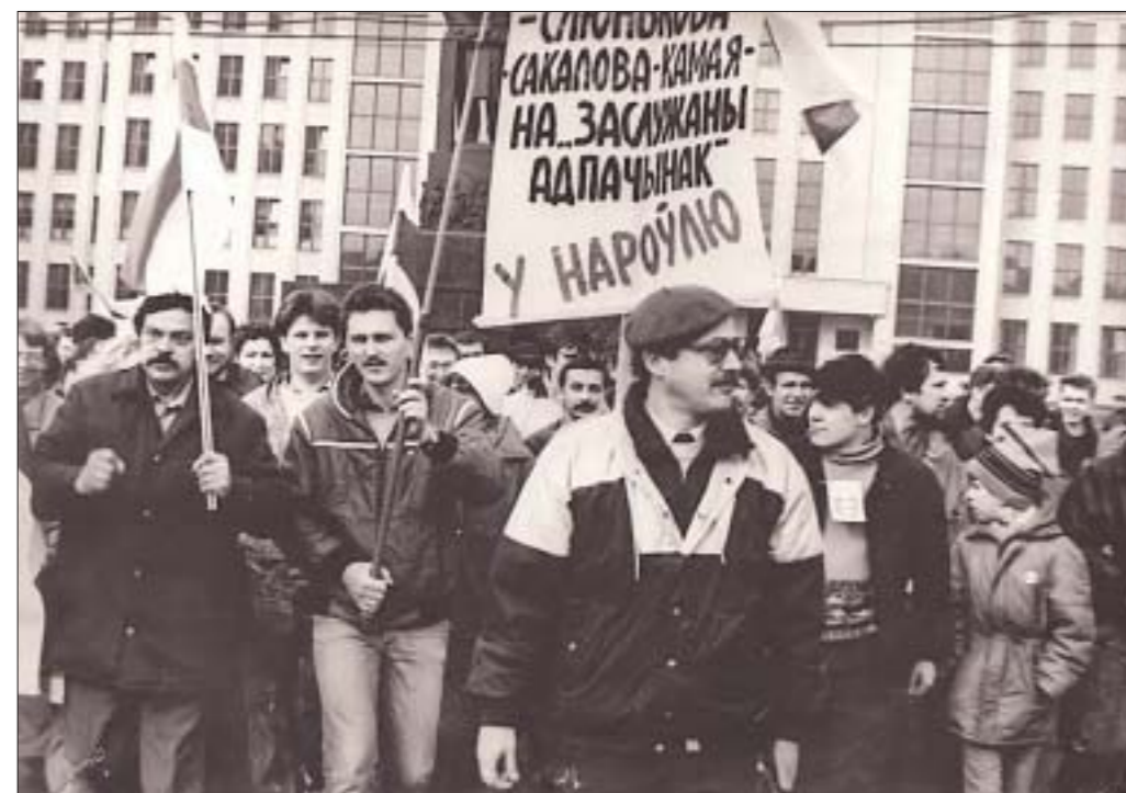
7 лістапада 1990 года. Першае ў СССР масавае антыкамуністычнае шэсце. На чале калоны Фрунзенскага раёна сталіцы я прывёў пяць, а можа, і восем тысяч чалавек на плошчу імя Уладзіміра Леніна перад Домам урада. Я быў кіраўніком гэтай калоны, якую, на рашэнні імя БНФ, мы сфарміравалі на вуліцы імя Сяргея Прытыцкага. Прычыны гэтай антысавецкай дэманстрацыі — Чарнобыль і неабходнасць з'явіць камуністычныя сістэмы. Мы прыйшлі праз увесь горад патрабаваць, каб прыбралі увесь гэты ўрад і ўсю гэтую ўладу, каб адмянілі ўсе гэтыя камуністычныя прывілеі, каб на Чарнобылю было прынята асобнае заканадаўства.