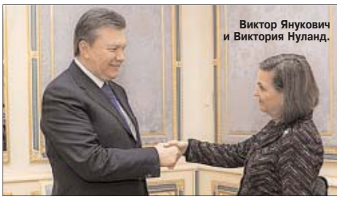
Виктор Янукович и Виктория Нуланд.

Госдепартамент США отказался как подтвердить, так и опровергнуть подлинность записи разговора, сообщается на сайте Euronews.net.