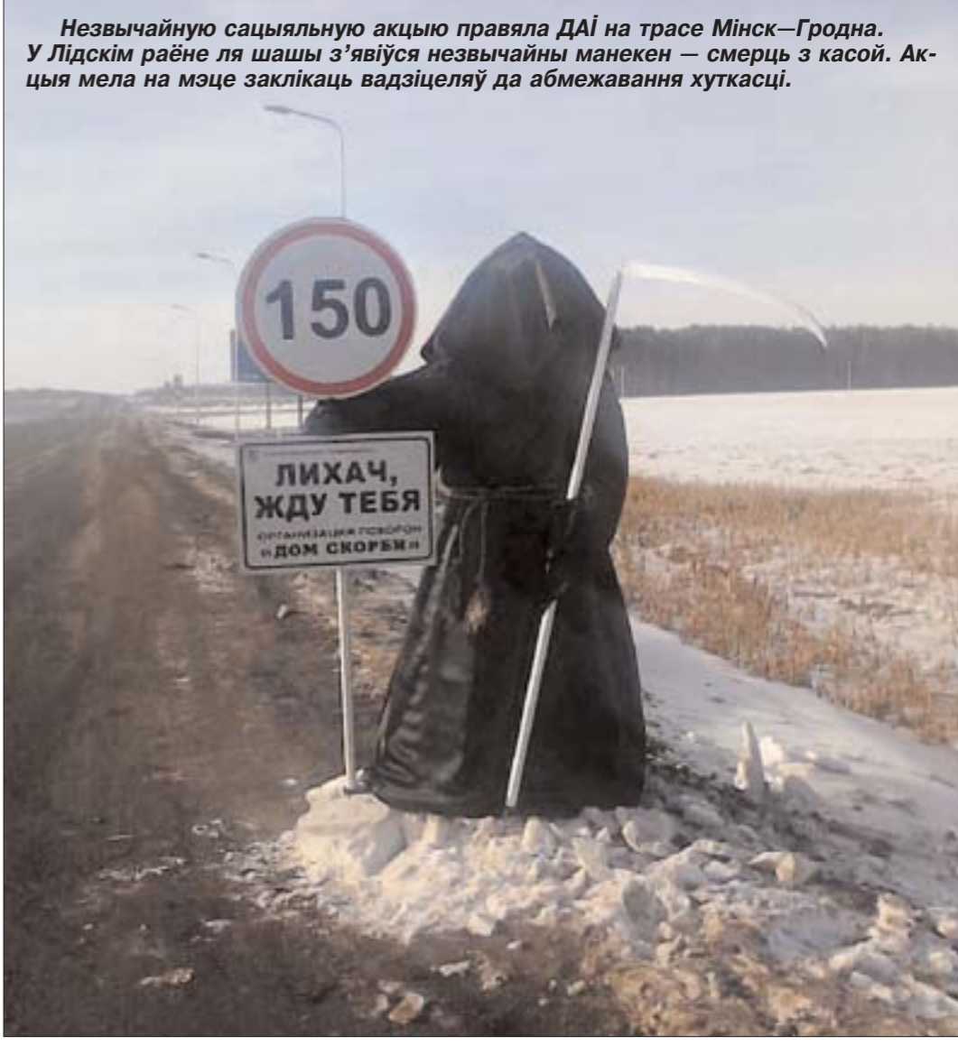
Незвычайную сацыяльную акцыю правяла ДАІ на трасе Мінск—Гродна. У Лідскім раёне ля шашы з'явіўся незвычайны манекен — смерць з касой. Акцыя мела на мэце заклікаць вадзіцеляў да абмежавання хуткасці.