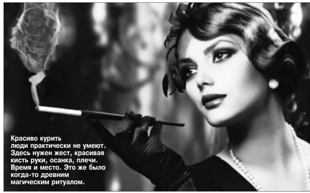
Красиво курить люди практически не умеют. Здесь нужен жест, красивая кисть руки, осанка, плечи. Время и место. Это же было когда-то древним магическим ритуалом.

антитабачный закон, проект которого проходит сейчас общественные обсуждения, будет принят в Беларуси в следующем году? Надежды мало. Или будет принят, но пока с большими оговорками в пользу курильщиков. Продажа сигарет (они, кстати, дорожают с 1 декабря) дает в казну немалые прибыли. Как и алкоголь, казино. Так что пока в стране работают игорные дома, пока крепкие напитки будут продаваться в каждой лавке, оставят лезайки и для курильщиков. Сизий дым не скоро рассеется над Беларуссью. Бедным странам не по карману нравственность. Как и настоящая забота о здоровье граждан.