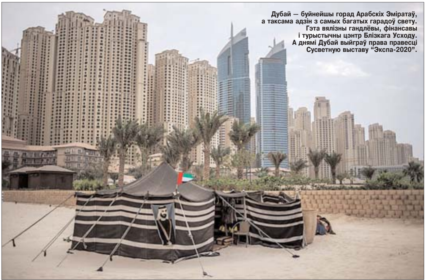
Дубай — буйнейшы горад Арабскіх Эміратаў, а таксама адзін з самых багатых гарадоў свету. Гэта вялізны гандлёвы, фінансавы і турыстычны цэнтр Блізкага Усходу. А днямі Дубай выйграў права правесці Сусветную выставу «Экспа-2020».

Зато милиция нашего Вороновского РОВД точно знает, что нужно делать с такими искателями демократии, — передали человека пограничникам. И все-таки я бы предложил мирное решение вопроса. Пускай этот молодой литовец плывет обратно. Организуем ему торжественный заплыв в обратную сторону — с проводами, речами, музыкой. Ну как положено. И пускай на берег этой самой Шальчи придет из Вильнюса, оторвувшись на часок от своего саммита самые высокие европейские деятели. Ну даже если не подлишет Украина евроинтеграцию... Зато Беларусь как будет выглядеть!