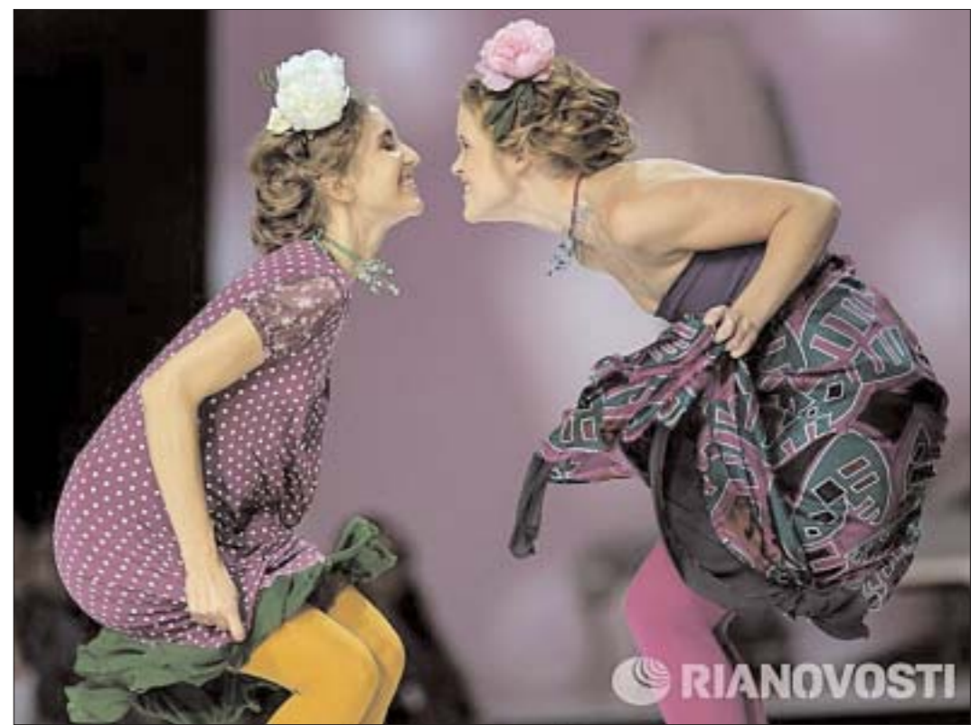
Очередной сезон московских модных недель познакомил гостей с основными тенденциями моды pret-a-porter разных ценовых сегментов — от дизайнерской одежды до продукции масс-маркета. На фото: показ дизайнера Елены Теплицкой в рамках Недели моды в Москве.