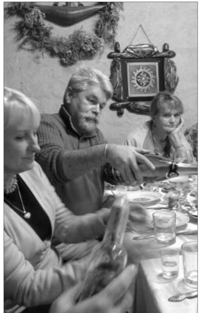
За такі тост грэх было не выпіць...