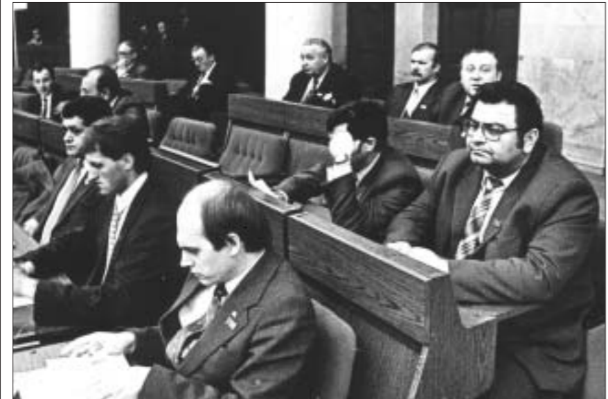
Праца на сесіі Вярхоўнага Савета, 1991 год.

— Звярніцеся да вытворцы з патрабаваннем замены. А лепш за ўсё — звярніцеся да спецыялістаў па абароне правоў спажываўцоў.