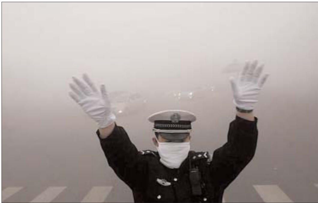
Густой смог в Китае.