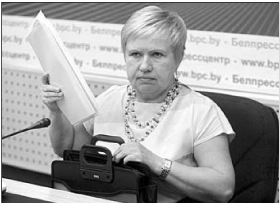
Я, я им отдал, чтобы ЦИК их зарегистрировали. Зарегистрировали всех, под железным моим давлением! — сказала Лукашенко.

Я считаю очень вероятным проведение досрочных президентских выборов в 2014 году, потому что финансовые дела у правящего режима неважные и спокойно дожить до 2015 года может не получиться.