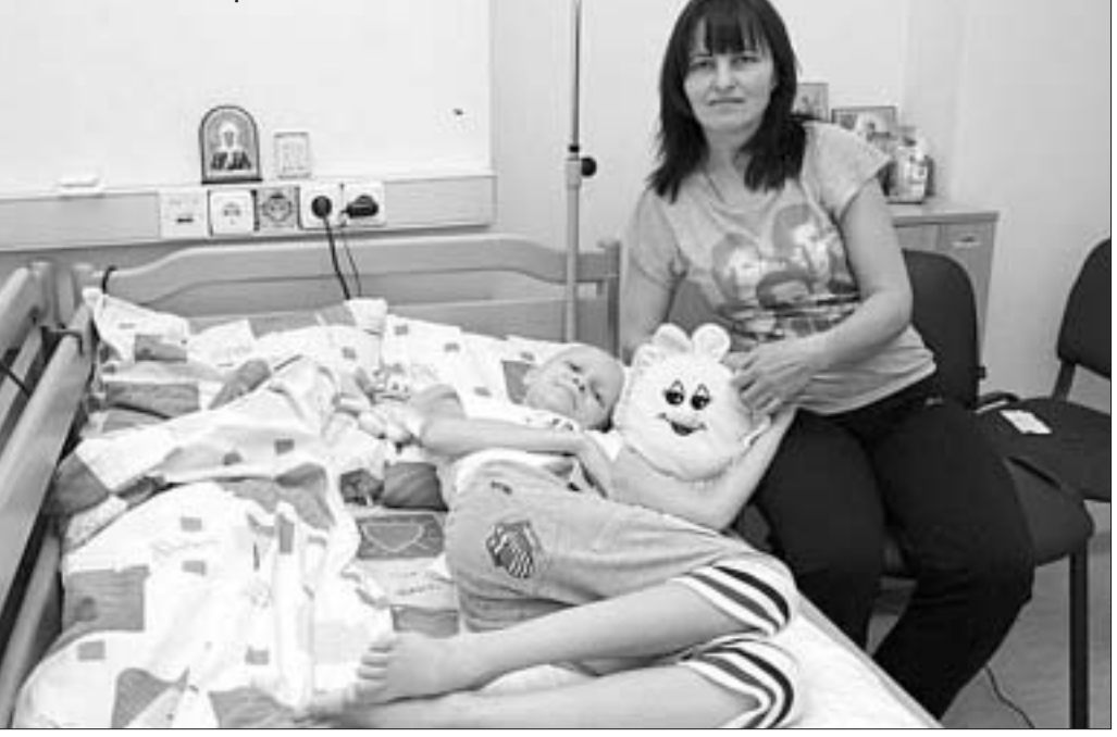
С мамой в больнице.