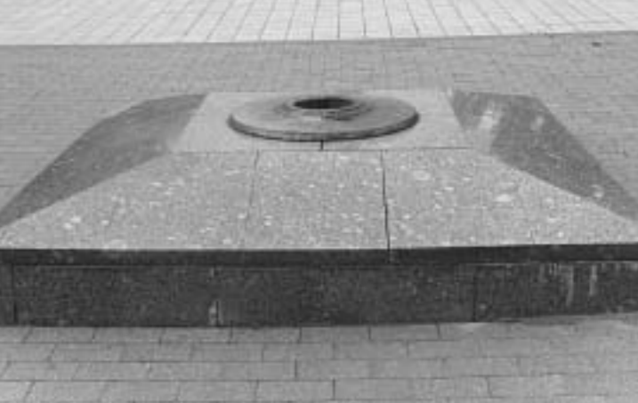
Марта МАХУН. Фото автора.