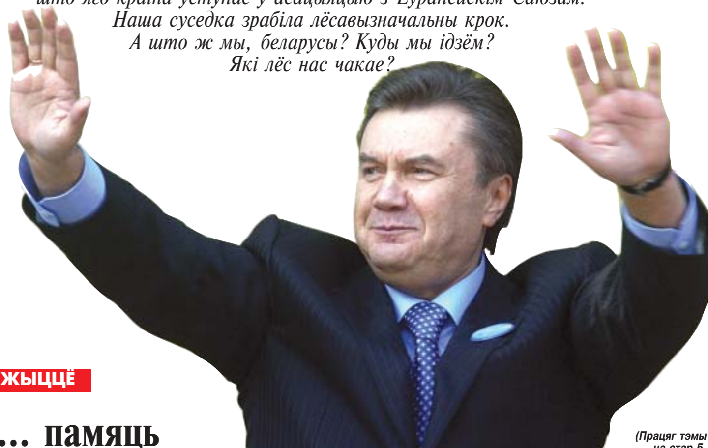
(Працяг тэмы на стар. 5.)

Прэзідэнт Украіны Віктар Януковіч заявіў пра тое, што яго краіна ўступае ў асацыяцыю з Еўрапейскім Саюзам. Наша суседка зрабіла лёсавызначальны крок. А што ж мы, беларусы? Куды мы ідзем? Які лёс нас чакае?