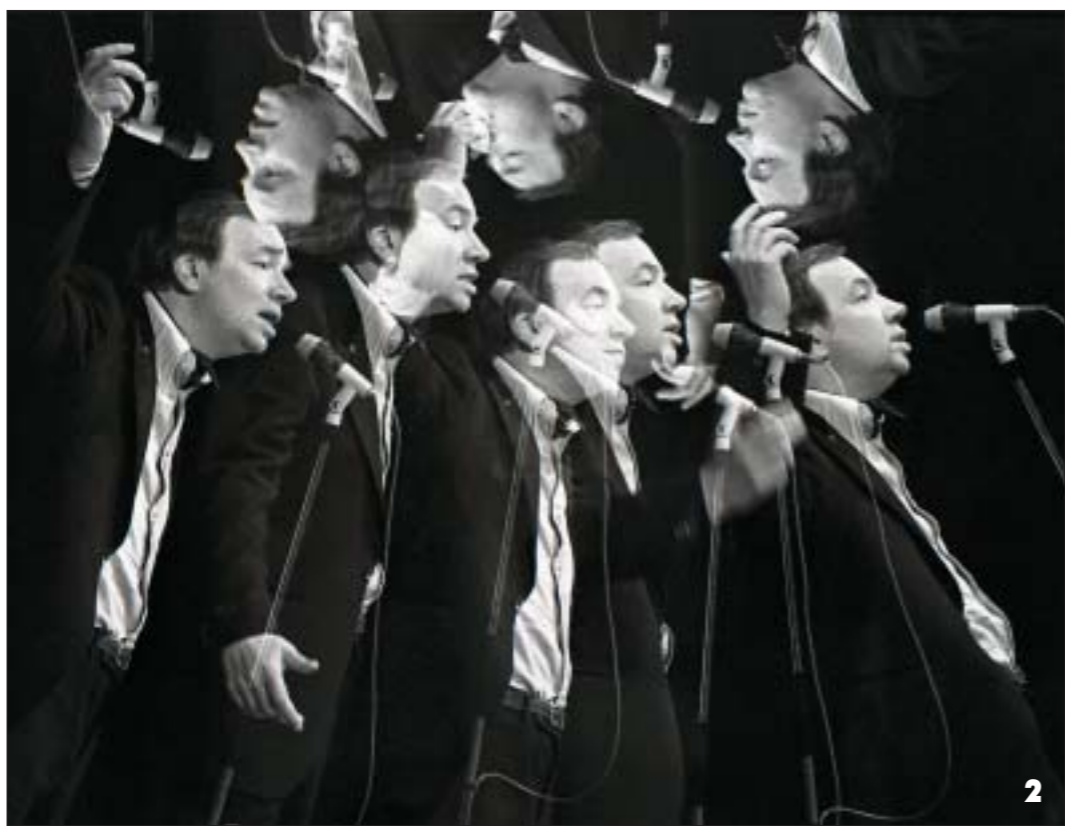
1. Ваза. Это уникальное сооружение из людских тел появилось на демонстрации трудящихся 1 мая и 7 ноября. Снимок сделан 1 мая 1987 года. 2. Андрей Вознесенский. Антимирь! Фантасты посреди мурь. Без глупых не было бы умных, оазисов без Каракумов... 1975 год. 3. Выставком. Очередная отчетная выставка Союза художников в Минском дворце искусства. Жюри знакомится с экспозицией. 2007 год. 4. Голуби. 1982 год. 5. Военный дирижер. Урашением празднеств в советском Минске был духовой оркестр Белорусского военного округа под управлением народного артиста БССР, полковника Бориса Пенчука. 1974 год. 6. Сельские посылки. Самодельность Минской области. Фотографии с выставки Юрия Иванова "Между белым и черным".