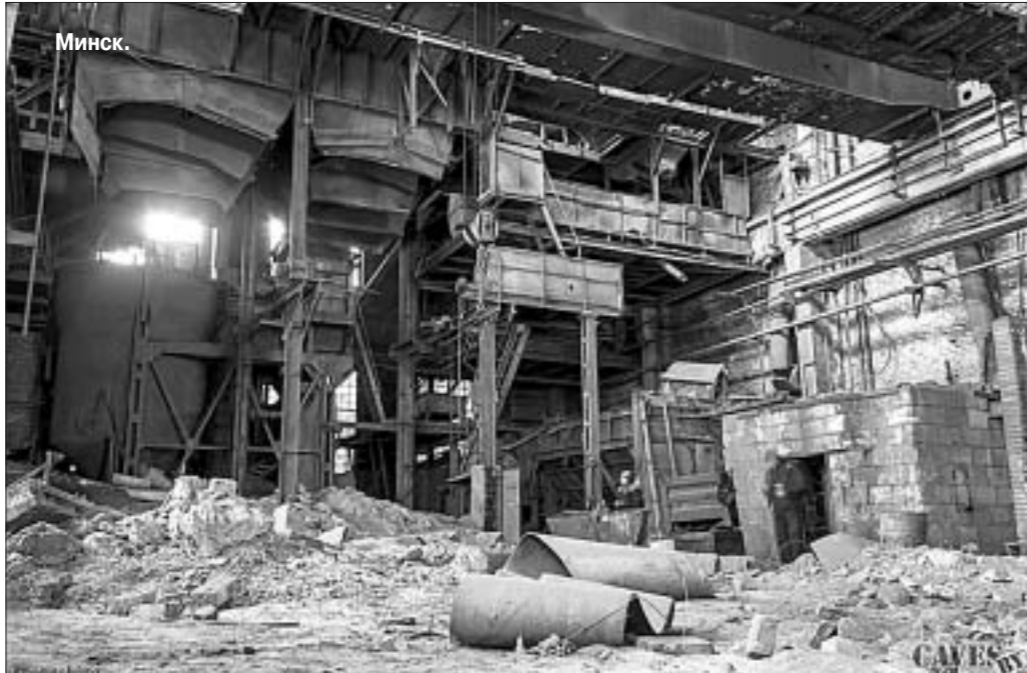
Детройт и Минск. Разницы, как видим, практически нет.

участвовали, а дизайн задавался инженерными решениями. В современном подходе есть и немало минусов, но так уж сложилось в «экономике впечатлений». И тот, кто современные принципы игнорирует, в большинстве случаев терпит провал на рынке.