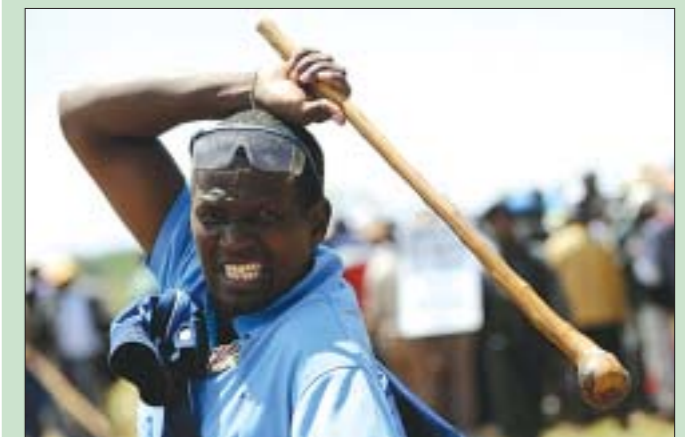
Самая гневная страна в мире — это ЮАР. Лидер по насилию и преступлениям среди развитых стран мира. Ежегодно в этой стране убивают 32 человека на каждые 100.000 населения. Также к жестоким странам отнесли Бразилию и Мексику.

Ученые мира провели массовое исследование — оценили все страны по степени их греховности и выбрали семь лидеров. Вот как фотографы проиллюстрировали их выводы.