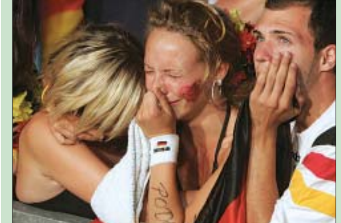
Зависть оказалась самым трудным грехом, поскольку его невозможно представить математически. Экономисты выявили лишь одну зависимость — между завистью и уровнем экономического неравенства: чем он выше, тем больше бедные завидуют богатым. Основываясь на этой закономерности, самыми завистливыми странами стали Германия, Австрия и Швеция. Блуд, по-научному переименованный в индекс сексуальной распушенности, зашкаливает в Финляндии. За Финляндией в рейтинге следуют Новая Зеландия, страны Балтии и Великобритания.