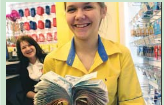
А вот в корысти лидирует Россия, поскольку в списке коррупционных стран она обогнала даже Индонезию с Мексикой, заняв 133-е место из 174.