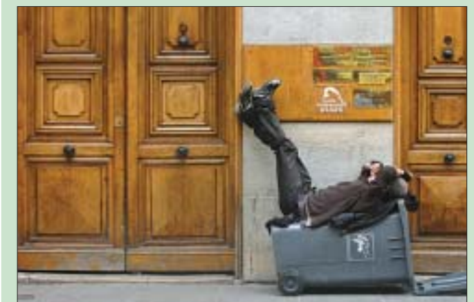
Леньность исследователи перевели в индекс работоспособности. Ее также можно измерить числом часов, отработанных за год средним экономически активным жителем страны. Минимальные показатели сосредоточились в Европе, где 1300–1500 часов в год считается нормой, в то время как в азиатских странах этот показатель составляет более 2000 часов.