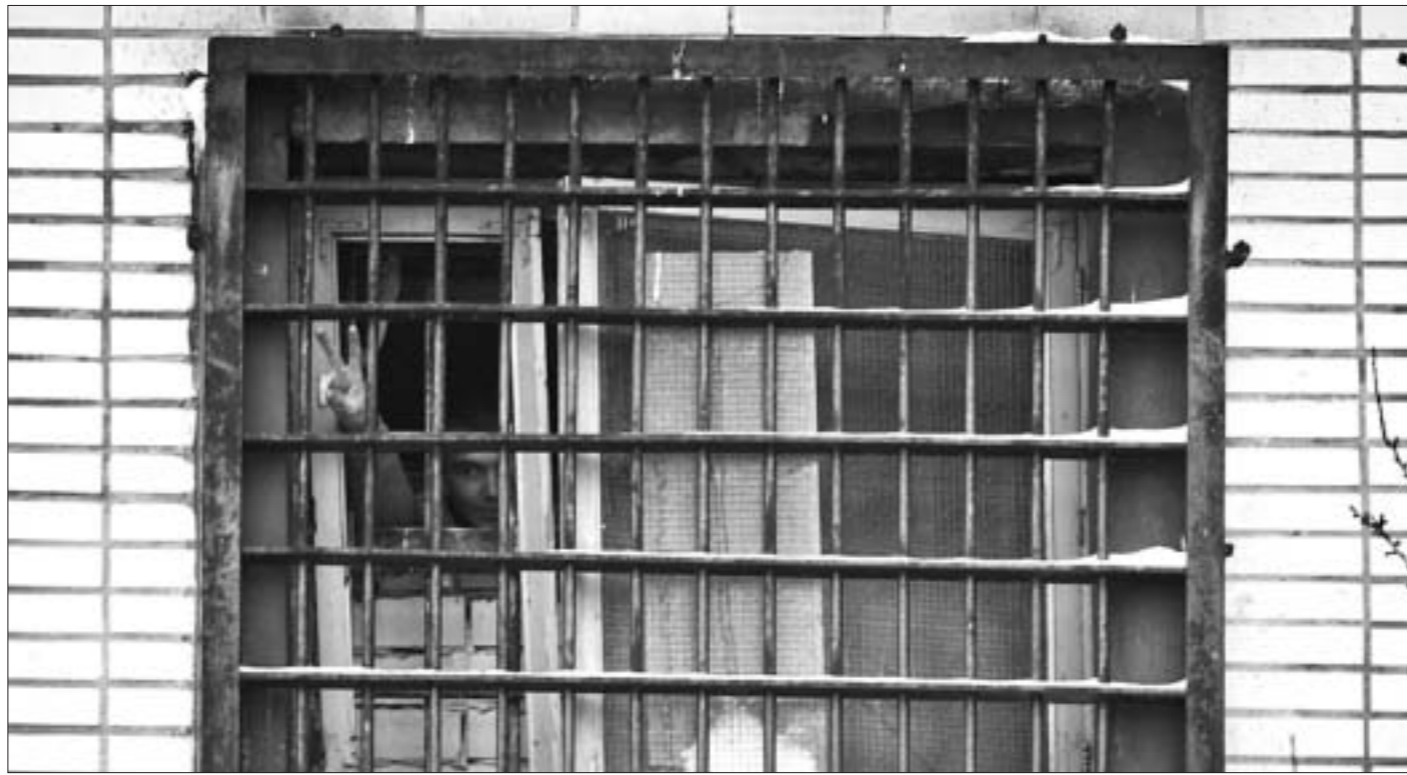
Хочу пожелать вам, служивые, только одного: чтобы вам приходилось заниматься только своим непосредственным делом — спасением жизни.

Вы внесли смутнение и в души его одноклассников. Когда я после своего освобождения привел сына в школу, они либо смотрели на меня испуганно и настороженно, либо отводили глаза и поворачивались спиной. До этого всегда здоровались, общались на равных. Тюремь в сознании детей связана с чем-то страшным, их первая реакция объяснима, но рано или поздно испуг пройдет. Тогда возникнет вопрос — почему доброго и отзывчивого папу нашего друга посадили туда, где место страшным и жестоким злодеям, жуликам и ворами?