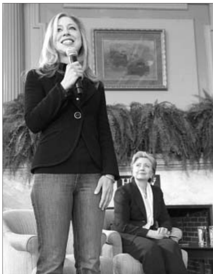
Дочь экс-президента США Билла Клинтона и Хиллари Клинтон Челси Клинтон активно занимается общественной деятельностью, а также с детства является веганом. В 2011 году она убедилась своего отца также начать следовать веганской диете.