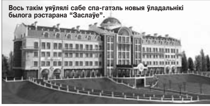
Вось такім уяўлялі сабе спа-гатэль новага ўладальніка былога рэстарана "Заслаўе".

весілі відэакамеры і таблічкі "Прыватная тэрыторыя", паставілі некалькі будаўнічых вагончыкаў. І ўсё на гэтым. Разваліны па гэты дзень стаяць некранутымі, але агароджанымі. На пашпарце аб'екта пазначана: "Пачатак будаўніцтва — красавік 2011 года, заканчэнне — красавік 2014 года". Аднак зра-завыстаўвалі яго ў якасці туалета і імправізаванай звалкі. Некаторы час таму "Заслаўе" перададзі аўкцыён. Тэрыторыю агародзілі плотам з сеткі, вакол раз-