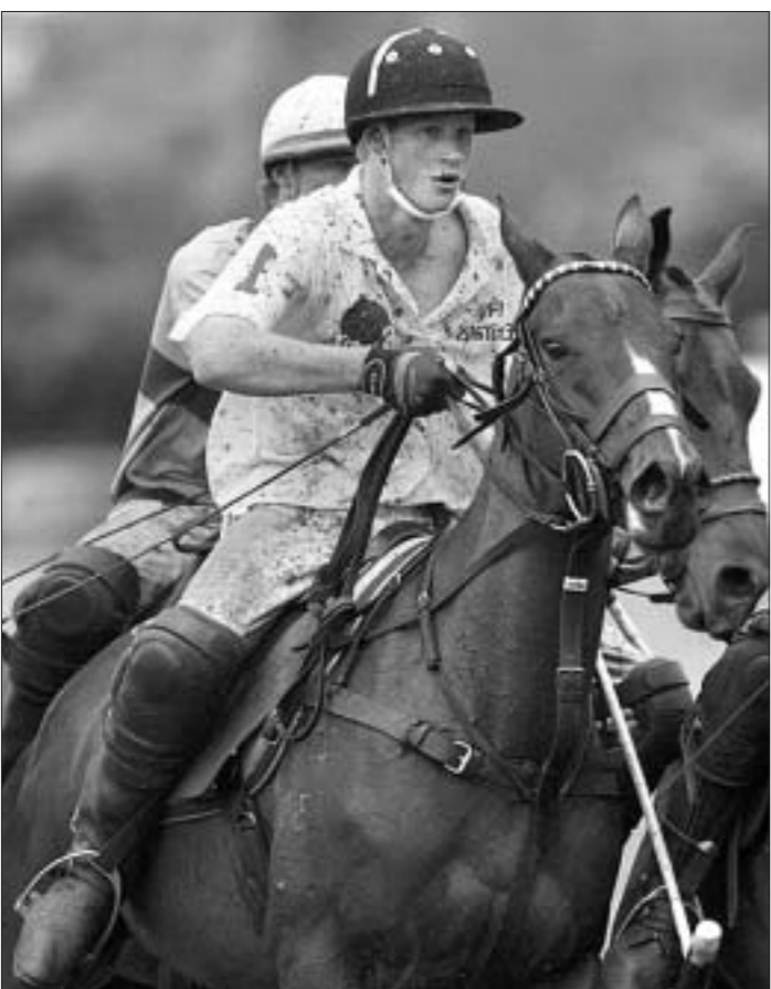
Младший сын принца Уэльского Чарльза и его первой жены принцессы Дианы принц Гарри, поимом водного поло, увлекается конным спортом.