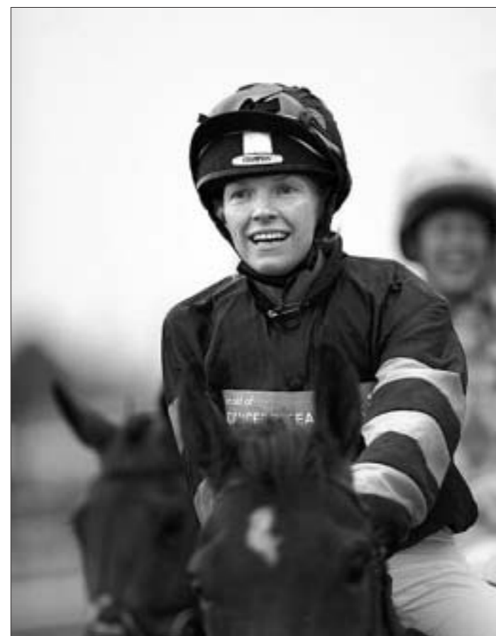
Дочь австралийского и американского предпринимателя и медиа-магната Руперта Мердока Элизабет снимается в кино и старается уделять время конному спорту.