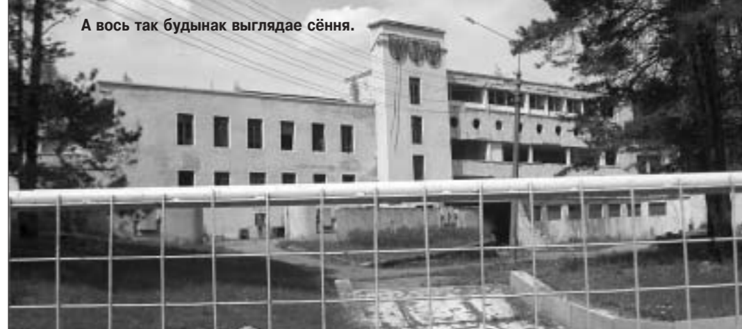
А вось так будынак выглядае сёння.

"Новабудоўля спраектавана ў стылі палацава-замкавай архітэктуры, які нагадвае стыль французскага рэнесансу, — так тры гады таму ў прэсе са спасылкай на словы канкрэтных асоб распавядалі пра спа-комплекс, які неўзабаве павінен з'явіцца на месцы "Заслаўя". — Гатэль будзе валодаць аўтаномнымі сістэмамі жыццязабеспячэння. Пры гэтым разам з узвядзеннем самога аб'екта будзе ажыццэўлена і добраўпарадкаванне зямельнага участку, на якім ён размяшчаецца. Гаворка ідзе пра больш чым 4 га зямлі на тэрыторыі вадасховішча. Па факце завяршэння будаўніцтва пляжы, якія належаць гатэлю, будуць адкрыты для ўсіх адпачыва-