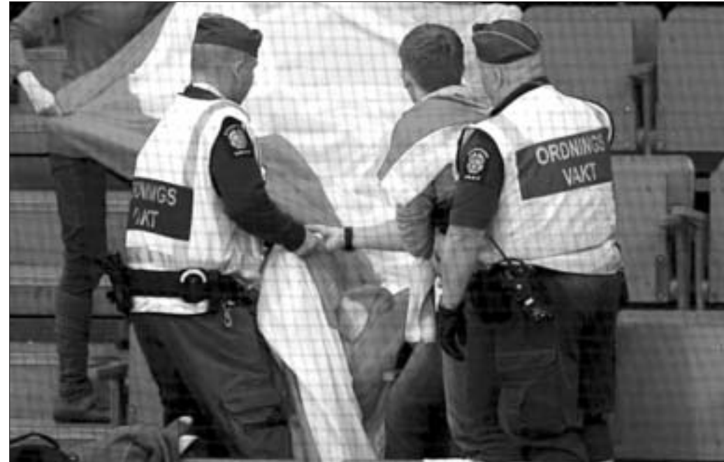
Фота Арнда Вігмана / Рэйтар. Служба аховы чэмпіянату прымушае згарнуць сцяг.

Аб гэтым паведамлілі ў Бельгерадзі кампаніі. Нагадаем, што конкурс "Еўрабачанне" адбудзецца з 14 па 18 мая ў шведскім Мальме.