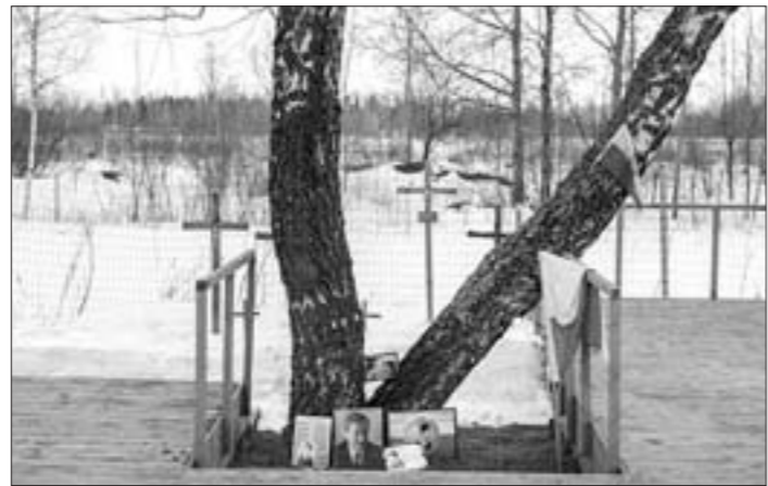
На фота: Месца катастрофы сёння.

Яны вывелі на вуліцы Варшавы дзясяткі тысяч людзей, якія прайшлі маршам па горадзе, праслухалі выступленне Яраслава Качыньскага перад Прэзідэнцкім палацам. Гэтае мерапрыемства не афіцыйнае. На афіцыйным узроўні ўсё было больш сціпла — набажэнства з удзелам афіцыйных асоб, кветкі на мемарыяльных знаках, прысвечаных ахвярам катастрофы.