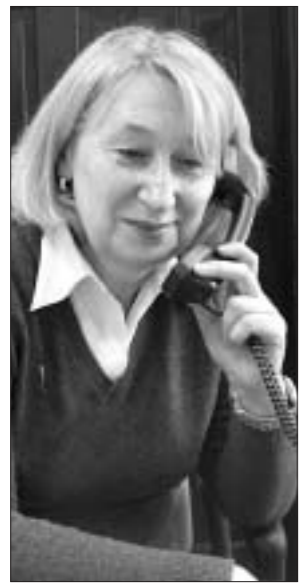
(Окончание. Начало в №26.)