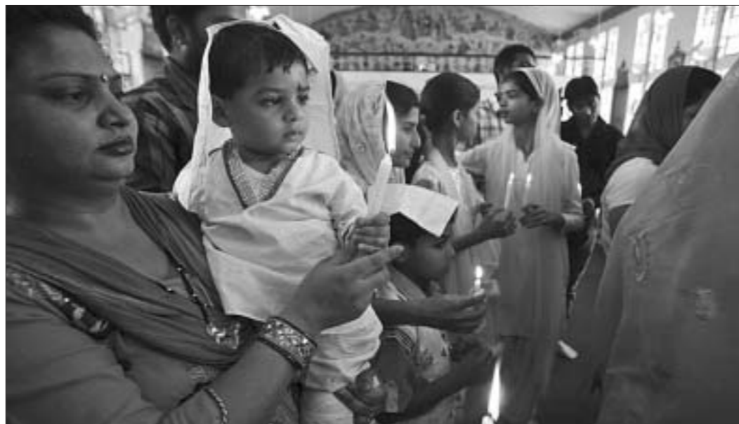
Сабраліся на службу і веруючыя індыйскага штата Джаму.