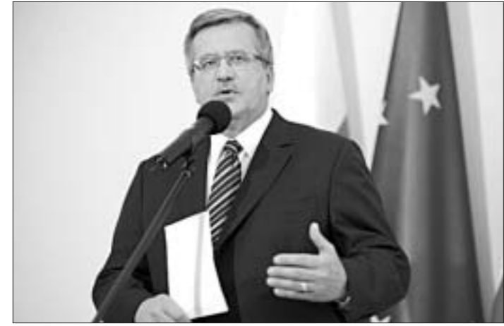
"Права і справядлівасць" Яраслаў Качыньскі (51% апытаных). Чарговыя месцы займаюць прэм'ер-міністр Дональд Туск, старшыня Сейма Эва Копач і дэпутат ад партыі "Права і справядлівасць" Антоні Мацярэвіч. Усім ім не давярае 41% апытаных.

Найбольшы недавер выкажыў лідар леваліберальнай партыі "Рух Паліката" Януш Палікот (яму не вераць 56% рэспандэнтаў) і кіраўнік правай арыентацыі партыі