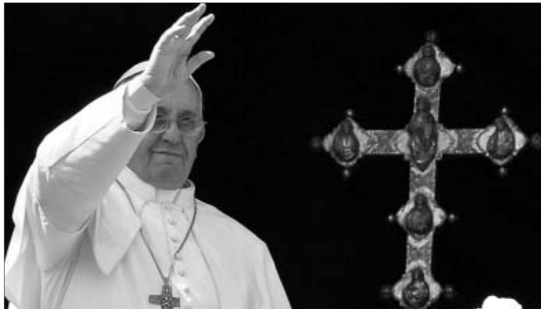
Папа Рымскі Францыск упершыню адслужыў пасхальную месу на плошчы Святога Пітра ў Ватыкане з заліканам да свету.