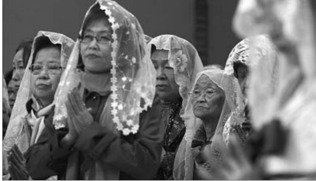
У каталіцкіх саборах у Сеуле маліліся за мір.