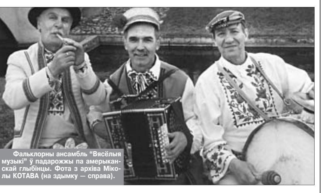
Фальклорны ансамбль "Вясёлыя музыкі" ў падарожжы па амерыканскай глыбіцы. Фота з архіва Міколы КОТАВА (на здымку — справа).

радзіме. Столькі часу — з бальніцы ў бальніцу, адольваючы бяду за бядой... Хіба вытрымаў бы, акрыяў, калі б не адчуваў, што не забыты, калі б не найшаму патрэбны многім? Паўна, мне шанце ў жыцці, калі руку дапамогі і спягады працяваюць самыя розныя людзі, якім няма свата, але якія ставіліся і ставяцца да мяне, як да роднага. Што чужоўныя дактары, сястрычкі і нянечкі, якія мяне лячылі-выходжвалі, што даўня знаёмцы з розных куткоў Беларусі, дзе даваўся павываць са сваім ансамблем, што самі калегі па творчай працы. І з Жыткавічаў прадстаўнікі раёна прыязджалі, і малыя вёскач Семурадчы, Чэрныя, Перароў і Пагост госці. Былі і вясковыя настаўнікі, і фермеры, і куратары з Міністэрства культуры. А Гомельскія абласныя цэнтры народнай творчасці выдаў маю кніжку "Традыцыі беларускага народа (25 сцэннічных пастановак абрадаў)" — вось дык падарунак сэрцу! Даведаўся, што некаторыя з гэтых пастановак ужо ідуць у сталічныя гімназія. А хор ветэранаў вайны і працы са Служка запрасыў мяне дапамагчы ў падрыхтоўцы да