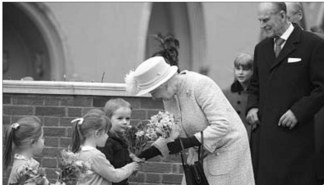
Каралева Вялікабрытаніі разам з прынцам Філіпам павывала на богаслужэнні ў часоўні Святога Георгія ў Віндзорскім замку.