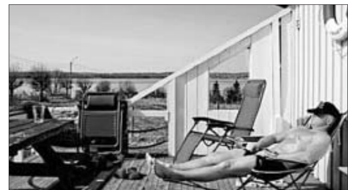
Это — правосудие для всего общества. И, как пишет Guardian, уровень рецидивизма среди бывших заключенных острова Бастой горвит сам за себя. Лишь 16% вновь совершают преступления. Это самый низкий уровень рецидивизма в Европе.

тюрьме. Это правосудие. Я не сумасшедший, я реалист. Здесь мы относимся к заключенным с уважением, так мы их учим относиться с уважением к другим. Но мы все время за ними смотрим. Очень важно, чтобы они не совершали преступлений после того, как они выйдут на свободу. Это — правосудие для всего общества". И, как пишет Guardian, уровень рецидивизма среди бывших заключенных острова Бастой горвит сам за себя. Лишь 16% вновь совершают преступления. Это самый низкий уровень рецидивизма в Европе.