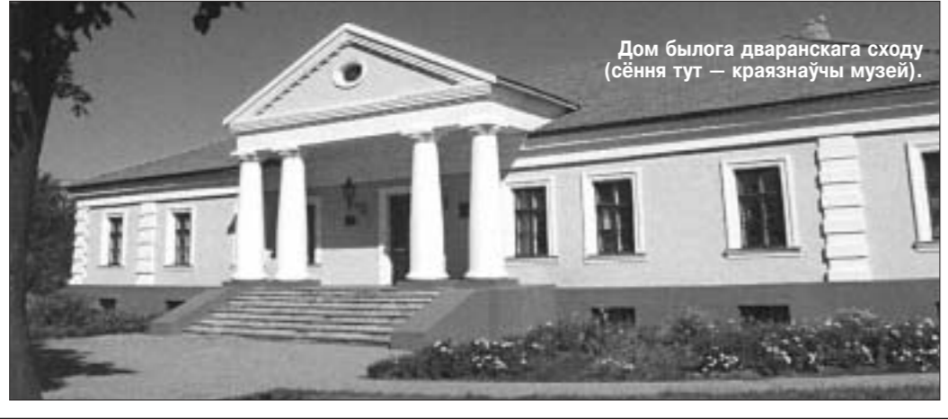
Дом былога дваранскага сходу (сёння тут — краязнаўчы музей).

Цікавым у той мясціне бачыцца і факт з ваеннага і пасляваеннага жыцця. Непадальку ад узгаданай электрастанцыі, бліжэй да моста праз Случ, на вуліцы Валадарскай — працягу былой Магаставой вуліцы (сёння вуліца М.Багдановіча) у час вайны немцы ўзвялі чатыры дзьготуныя драўляныя дамы.