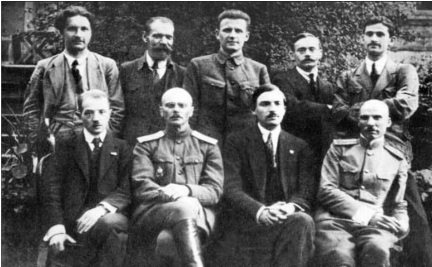
Першы ўрад БНР — Народны Сакратарыят: (злева направа, сядзяць) Алесь Бурбіс, Іван Серада, Язэп Варонка (старшыня), Васіль Захарка ; (стаяць) Аркадзь Смолч, Пётра Крэчэўскі, Кастусь Езавітаў, Антон Аўсяняк, Лявон Заяц .

25 сакавіка 1918 года раніцай была прынята рэзалюцыя аб незалежнасці Беларусі. І ў той жа дзень пасля артыкульнага абмеркавання была зацверджана Трэцяя ўстаўная грамата да народаў Беларусі . Гэтым гістарычным актам Беларуска Народная Рэспубліка абвешчалася незалежнай дзяржавай.