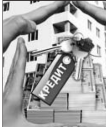
крупнейших американских ипотечных агентств Freddie Mac сообщили, что средняя ставка по жилищным кредитам со сроком погашения 30 лет за неделю опустилась с 3,56 процента до 3,51 процента.