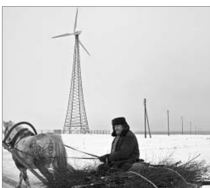
Тытуым выкарыстаннем энергіі ветру і вады. Спажыванне энергіі чалавекам стала расці вышэйшым тэмпамі.

Тэмпы спажывання энергіі чалавекам на працягу вякоў пастаянна ўзрастаюць. У старажытныя часы чалавек атрымліваў энергію выключна праз ежу, спажываючы ў дзень прыкладна 2000 ккал, што адпавядае магутнасці 100 Вт. Значна пазней, калі людзі сталі карыстацца агнём, выкарыстанне энергіі павялічылася прыкладна да 300 Вт у дзень аднаго чалавека. К 1200 году магутнасць энергіі, што выкарыстоўвалася чалавекам, павялічылася да 2 кВт у дзень. Гэта было звязана з распаўсюджаннем новых тэхналогій вядзення сельскай і паляўніцкай дзейнасці, з выкарыстаннем камяну для абгаровы жылых памяшканняў у будынках, з ак-