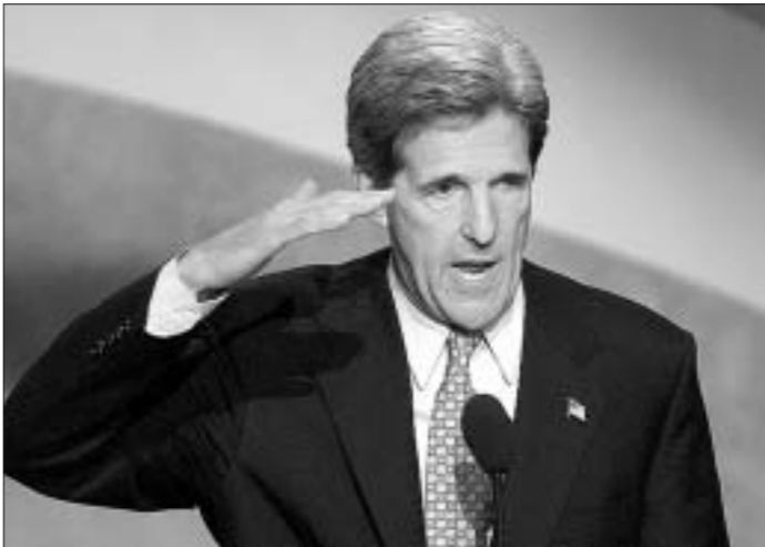
войны демонстративно бросил свои военные награды на лестницу Капитолия, выражая свое неприятие войны.

Он родился 11 декабря 1943 года в Денвере, штат Колорадо. Его отец был сотрудником дипломатической службы Государственного департамента США, мать — членом аристократической американской семьи Форбс.