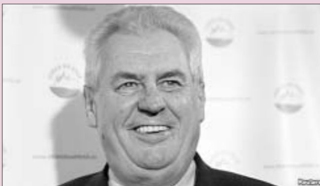
Он победил во втором туре президентских выборов, набрав 55% голосов избирателей. Это были первые в Чехии выборы, в ходе которых граждане избирали президента в ходе прямого голосования.

Триумфальное возвращение в большую политику Милоша Земана немало удивило чехов. 10 лет назад он потерпел униженное поражение, когда впервые претендовал на пост президента.