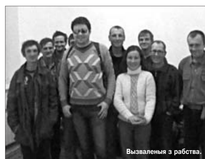
Вызваленыя з рабства.

Напрыканцы мінулага тыдня стала вядома, што падчас сумскага рэйду актывістаў расійскага маладзёжнага руху "Альтэрнатыва" і прадстаўнікоў МУС Рэспублікі Дагестан на цягніку за вузле, размешчаным ля вёскі Краснаармейск паблізу Махачкалы, былі вызвалены дзевяць чалавек, у тым ліку чатыры беларусы.