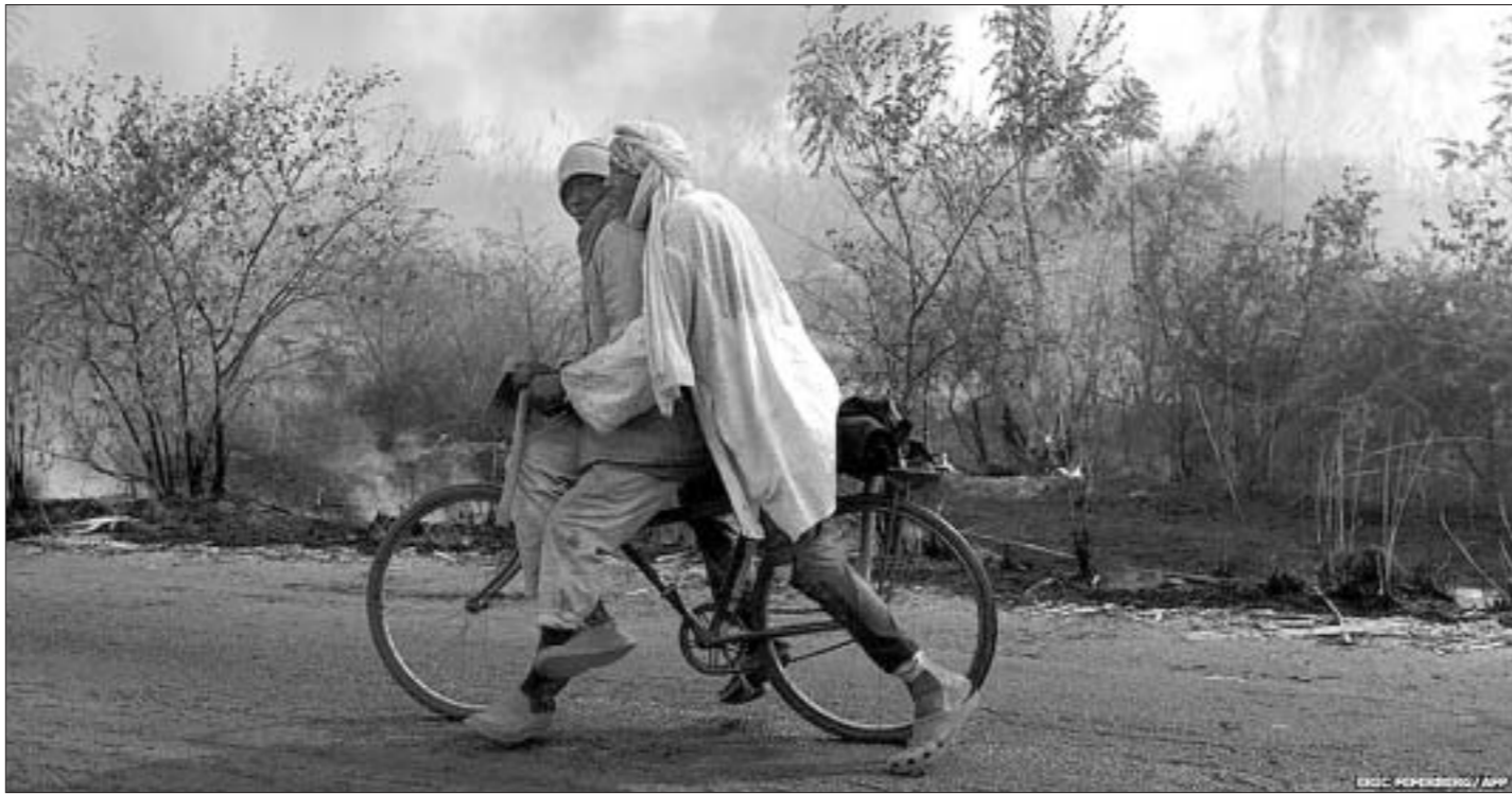
Гарьць плантацыя цуковага трыснягу, ідуць баі з ісламістамі ў Малі... Краіна перажывае самы вялікі палітычны крызіс за ўсю гісторыю.

Израильские и американские ученые обнаружили «значительную активность» мозговой деятельности у бывшего премьер-министра Израиля Ариэля Шарона.