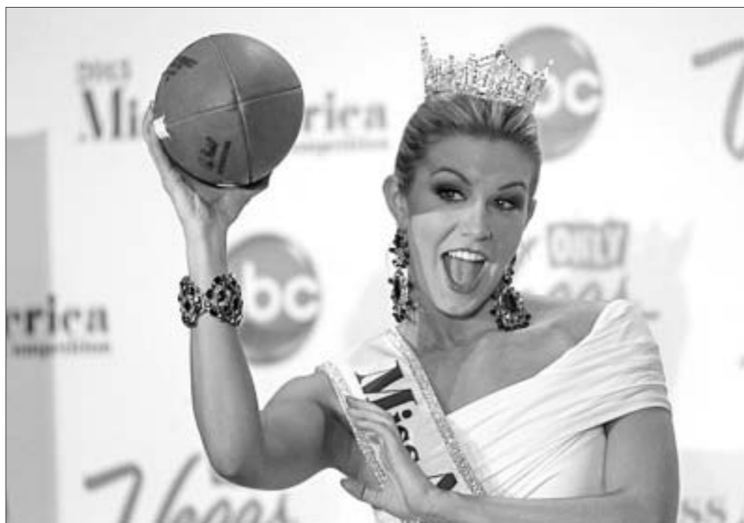
Вось такая яна, "Міс Амерыка-2013".