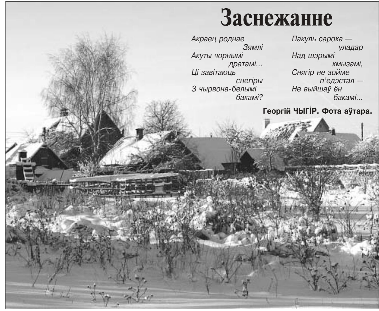
Георгій ЧЫГІР. Фота аўтара.