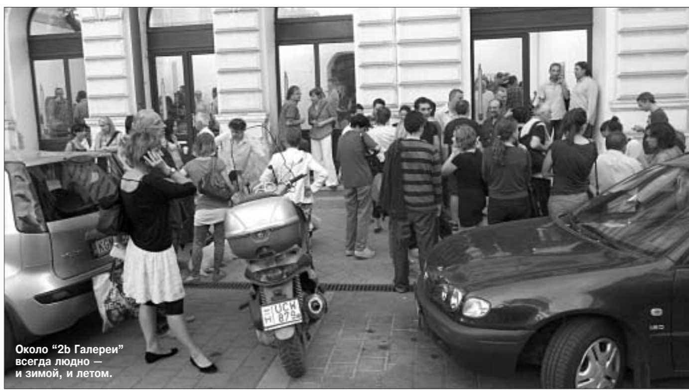
Около «2b Галереи» всегда людно — и зимой, и летом.