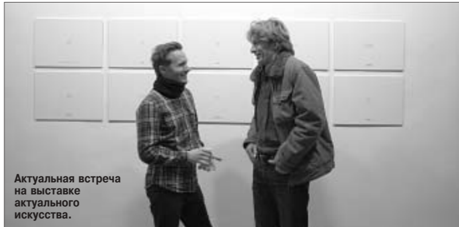
Актуальная встреча на выставке актуального искусства.