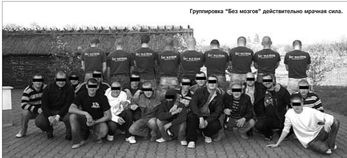
Группировка "Без мозгов" действительно мрачная сила.

Группировка "Без мозгов" запомнилась своими неадекватными деяниями. Например, выкладывала в интернете фото чернорубашечников, вскинувших руки в фашистском приветствии у "Звезд" — главного входа в мемориальный комплекс Брестской крепости, девушек в мини-юбках из флага со свастики или бритоголовых парней в майках с "фирменной" надписью. Правда, чтобы "нациков" не узнали, предварительно "размывали" им лица или накладывали на глаза черные полоски.