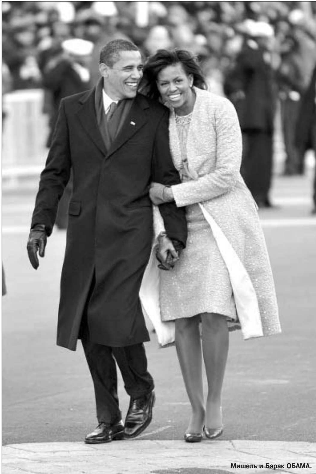
Мишель и Барак ОБАМА.

женщины, которую трудно заподозрить в том, что она держала дома шесть черепов, позвоночник, множество других костей и фотографии из морга. Полиция подозревает, что извращенка из Гетеборга собрала скелет из останков разных людей, которые сама и выкопала. Обвиняемая заявляет, что купила кости в интернет-магазине и не делала с ними ничего предосудительного.