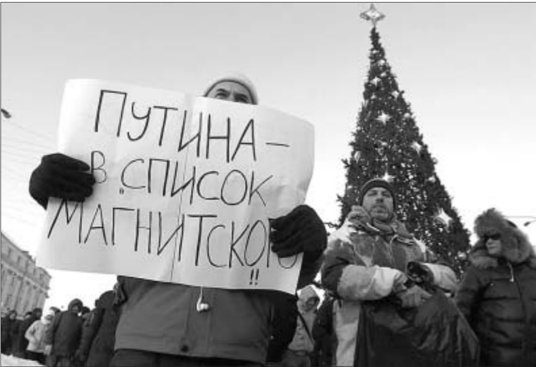
«Марш Свободы» в Москве

Задержаниями закончилась не санкционированная властями акция оппозиции «Марш Свободы» на Лубянской площади. По данным московской полиции, всего у Соловецкого камня — памятника жертвам политических репрессий в СССР — было задержано 40 человек. Гражданские активисты в свою очередь приводят большую цифру: сайт «ОВД-инфо» сообщает о как минимум 69 задержанных.