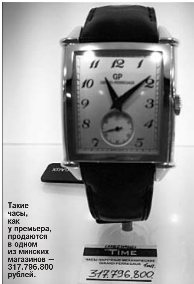
Такие часы, как у премьеры, продаются в одном из минских магазинов — 317.796.800 рублей.