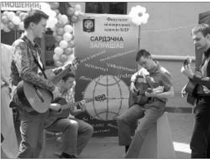
Студентов-“целевиков” на ФМО БГУ пока нет.