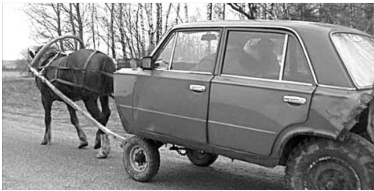
Прыдумай жа чалавек...