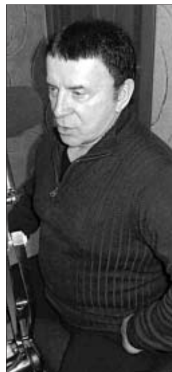
Особенно впечатлило организаторов то, что в концертной площадке отказали перед выступлением. «Это ведь не митинг или демонстрация, это культурно-зрелищное мероприя-

Изначально Кашпировский планировал выступить в Минске еще в сентябре, но поездка в белорусскую столицу была перенесена на октябрь. Сам Кашпировский говорил, что так решил его менеджер. Реклама была запущена во втором разу — всех страждущих приглашали в ДК «Солнечный парк» с 21 по 30 октября: большую часть сеансов Кашпировский планировал провести бесплатно. В Минск знакомый белорусам еще с перестроечных времен психотерапевт приехал загодя — 19 октября, и в тот же день встретился с местными журналистами. В первый день планируемых выступлений — в воскресенье 21 октября — около Дворца культуры собралось несколько десятков человек. Однако ни их, ни самого психотерапевта внутрь так и не пустили. Руководство ДК сообщило, что все выступления Кашпировского отменены по административным и техническим причинам.