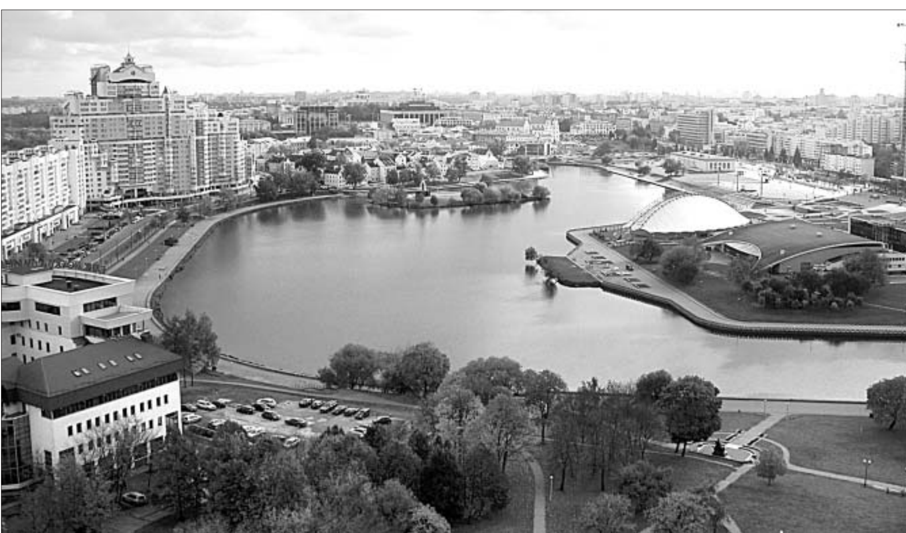
Мой любімы Мінск.