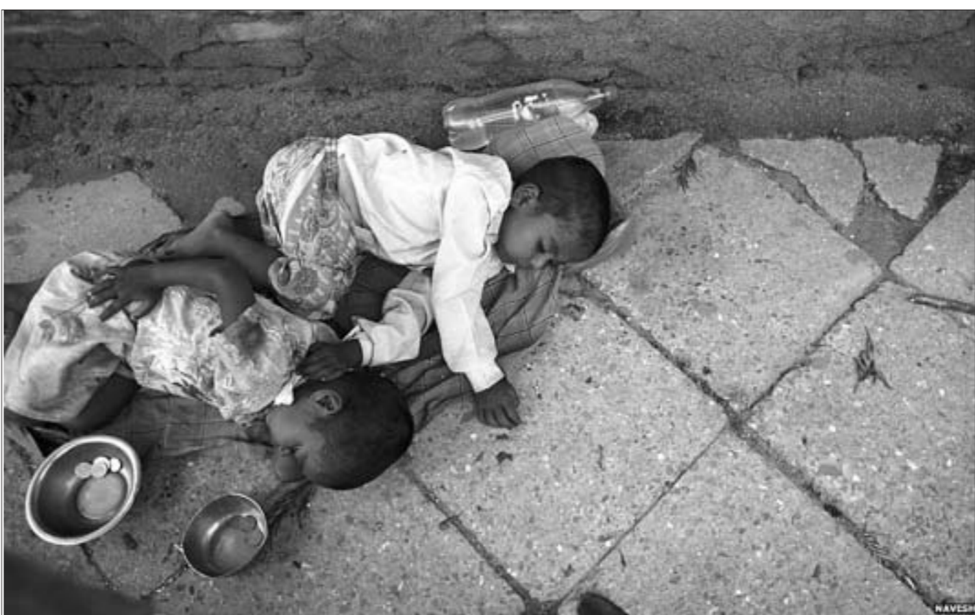
У сталіцы Непала Катманду дзеці з бедных сем'яў спяць прама на вуліцы.