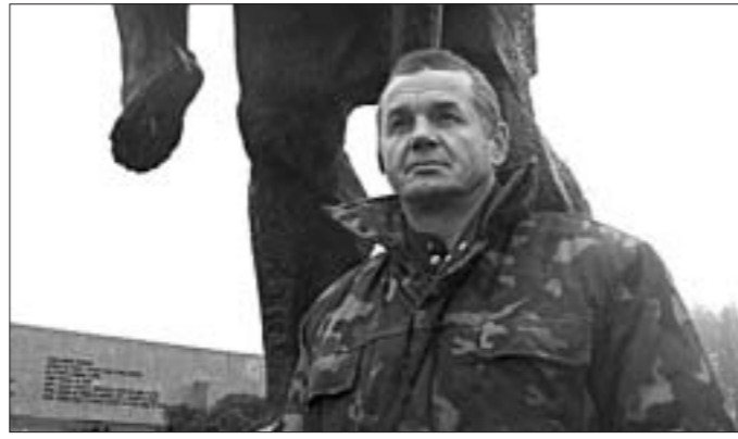
жэйны мемарыяльны комплекс! У мяне ёсць ахоўныя абавязкі, я перад міністрам адказваю за ахову гэтага аб'екта. Гэта, так бы мовіць, гістарычны спадчына Беларусі. Але Лагойскі рай-

Дырэктар комплексу «Хатынь» тады патлумачыў сітуацыю са сваёй «званіцы»: «Вы ведаеце, які ў нас помнік? Дзяр-