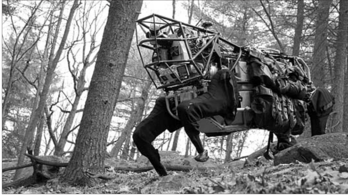
У США ідуць выпрабаванні ваеннага робата, які выкарыстоўваецца для транспарціроўкі цяжкіх грузаў па складанай мясцовасці.