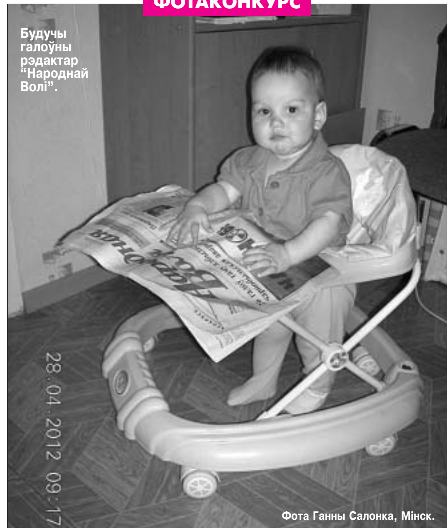
Будучи галоўны рэдактар «Народнай Волі».