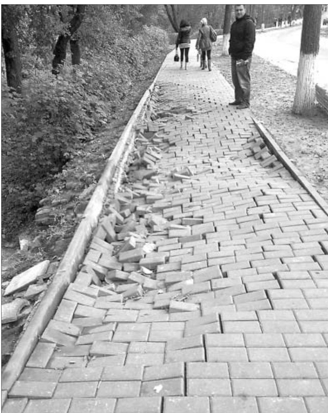
Горкі. Праз два тыдні пасля "Дажынак".