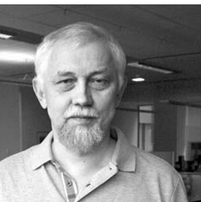
Дасье «Народнай Волі»

— Паводле яго слоў, пераход да профільнай адукацыі ў старэйшай школе павінен быць укаранены пры ўмове, што ў 10—11-ы класы з базавай школы будуць пераходзіць толькі вучні з высокай паспяховасцю, якія здольныя асвоіць паглыбленую праграму.