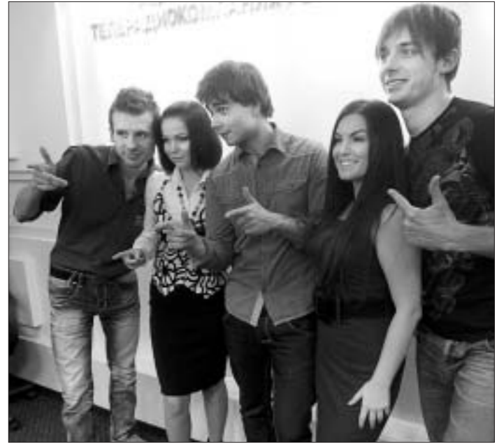
Пасля мінулагодняга скандалу вакол адбору на "Еўрабачанне-2012" "Белтэлерадыйёкампанія" зрабіла высновы...