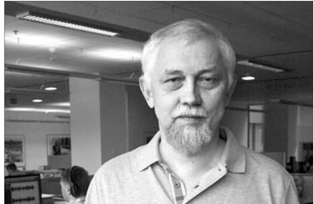
Дасье «Народнай Волі»