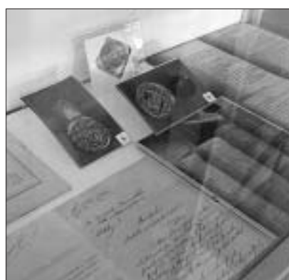
В холле главного корпуса мини-выставка. Копии книг, награды. Одним словом все, чем может гордиться университет.

но на английский. Язык международного общения стал единственным, например, для медицинского факультета в Мартине.