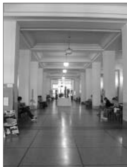
Холл главного корпуса. Правда, похож на главный корпус Белгосуниверситета?

Университет Коменского ориентирован на родной язык, но есть вузы, где образование полностью переведе-