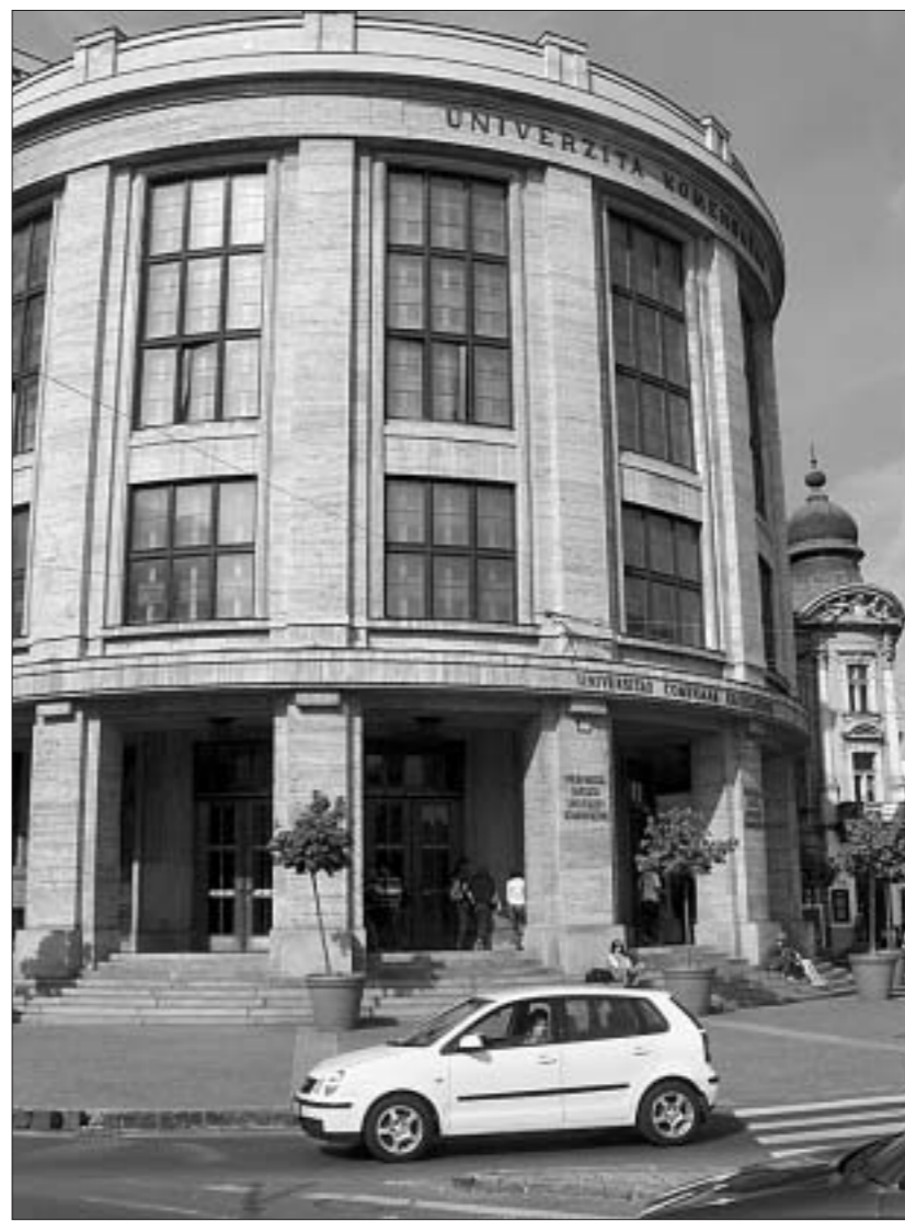
Главное здание Университета Коменского. Именно отсюда все начинается.

“На большинство специальностей нет вступительных экзаменов, — огорчила меня студентка братиславского