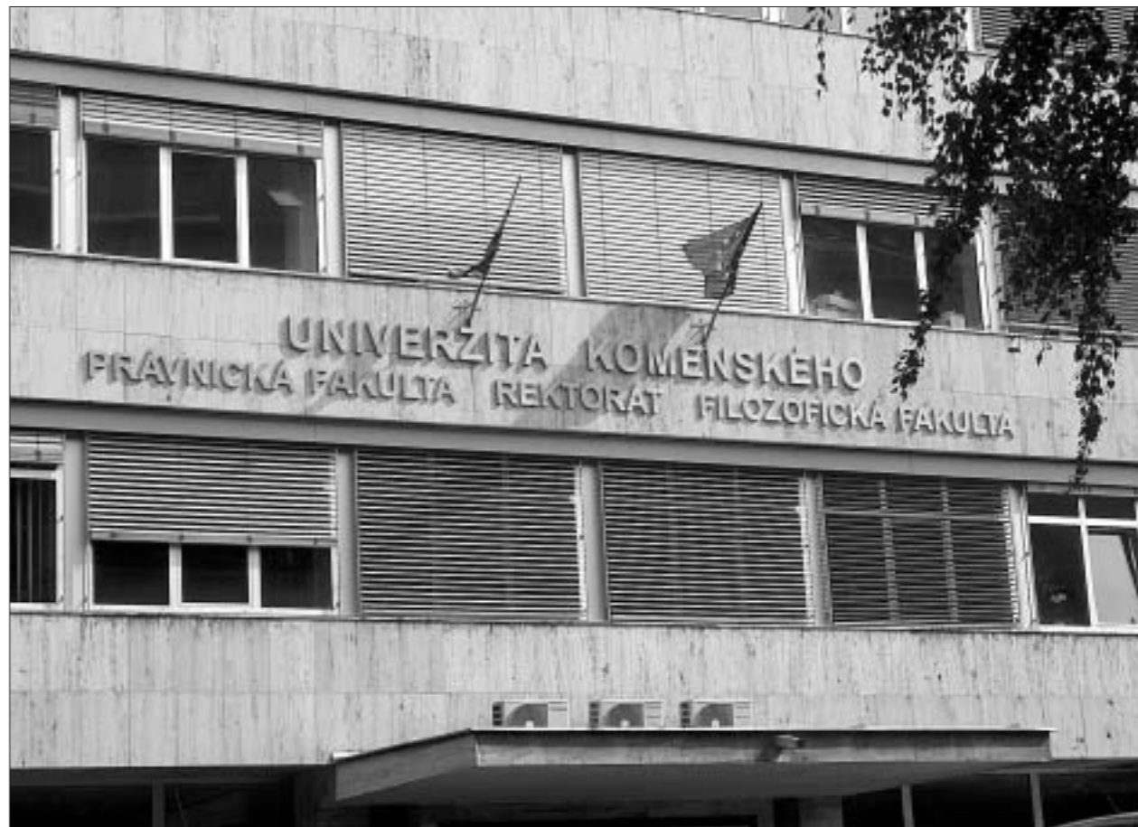
Это новый корпус университета.

вуза. — Нужно только тщательно собрать документы. Причем иногда готовить их необходимо уже в феврале. Если все в порядке, то в мае тебе придет письмо о зачислении в вуз”.