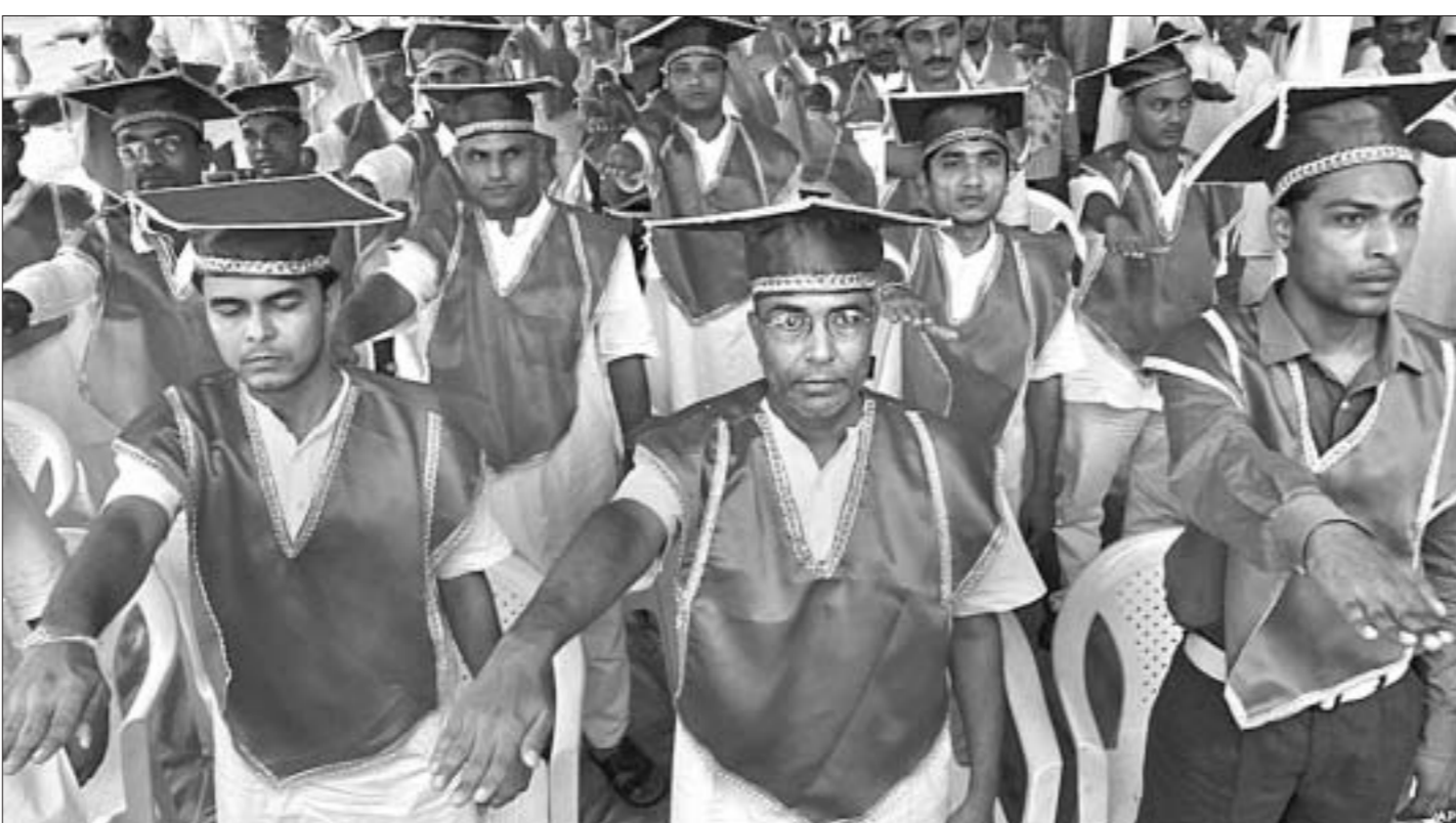
Каля 80 асуджаных турмы індыйскага горада Ахмадабад атрымалі дыпламы ўніверсітэта ў рамках праграмы перавыхавання і рэабілітацыі.

Голландский режиссер Ерун Вольф снял лица ста человек в возрасте «от 0 до 100 лет», чтобы наглядно продемонстрировать процесс старения. В результате по добровольцам, попавшим в сюжет длительностью 150 секунд, можно увидеть, какие изменения происходят во внешности человека по мере приближения к старости. Вольф останавливал людей на улицах Амстердама и просил их посмотреть в камеру и назвать свой возраст, сообщает британская газета The Daily Mail. Затем он собрал эти кадры в один ролик, и получилось удивительное видео, заставляющее задуматься о скоротечности времени. Открывает галерею ролика под емким названием «100» маленький ребенок, которому нет еще и года. Он, конечно, по понятным причинам не смог назвать свой возраст, поэтому просто посмотрел в камеру и показал язык. Промолчал и годовалый мальчик. Остальные участники проекта — от двух до 100 лет — свой возраст называли, как и просил режиссер. Завершается сюжет лицом улыбающейся столетней голландской бабушки.