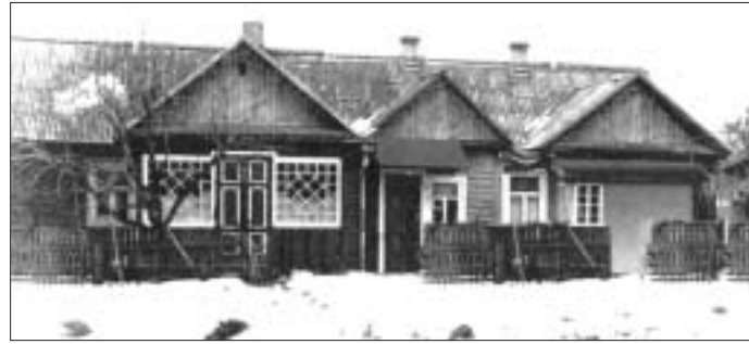
Хата ў Мінску, у якой нарадзіўся Ігар Лучанок.

Для дистанционного консультирования с более опытными врачами закуплены 13 передатчиков. Однако это вовсе не значит, что ЭКГ пересылают в каждом случае. Медики обращаются за помощью, когда они приехали на вызов к больному с острым коронарным синдромом и предварительно поставленный диагноз нужно подтвердить в кратчайшие сроки — для правильного оказания медпомощи на догоспитальном этапе.