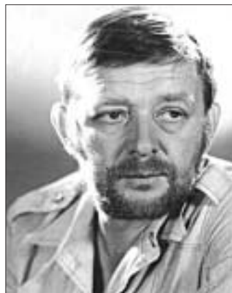
было. Не так даўно артыст перанёс інсульт.

Застолляў і вялікіх гулянняў з нагоды юбілею Мілаванава не