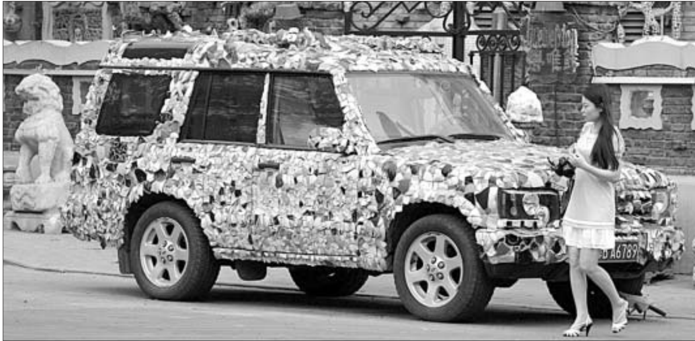
Вось так акблеўі сваю машыну фарфорам жыхар кітайскага горада Цяньзынь, калекцыянер вырабаў з фарфору Чжан Лянь Чжы. Цікаваць гараджан выклікае як машына, так і яго калекцыя.