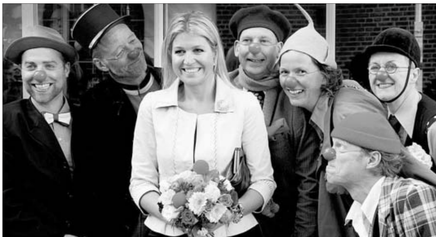
Принцесса Нидерланду Максима прыгала ўдзел у адкрыцці школы клоўнаў Clini Clowns College ў галандскім горадзе Амстерфорце. У школе будзе ісці спектаклі для цяжкахворых дзяцей.

Этот венский отель отмечен в качестве новаторского Международной ассоциацией туризма. Микаэла Райтер делится своей формулой успеха: «Для меня ключ к успеху — это вкладывать в «зеленые» технологии и самому жить в соответствии с декларируемыми нормами. Я обещаю вам, что в этом случае у вас будет много клиентов, хорошие доходы и хороший возврат по инвестициям».