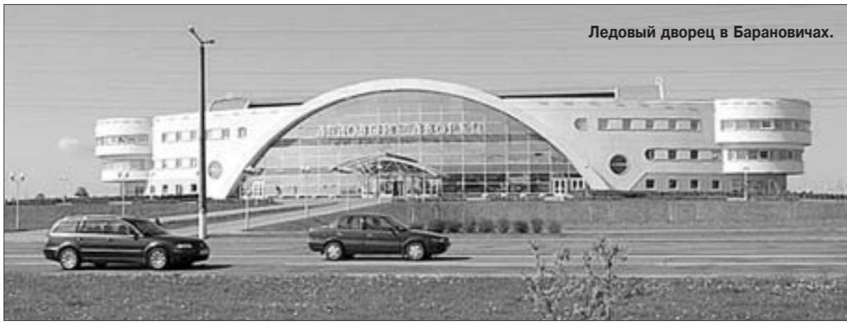
Ледовый дворец в Барановичах.

Нужно также учесть, что "Минск-Арена" весьма трудна для обслуживания. При ее возведении, к примеру, не подумали о том, как будут убирать от снега огромную многоступенчатую лестницу на входе. Не удивительно, что на "Минск-Арене", состоящей из ледовой арены, конькобежного стадиона и велотрека, работают 500 человек, тогда как на вдвое меньшей "Стил Арене" всего 13.