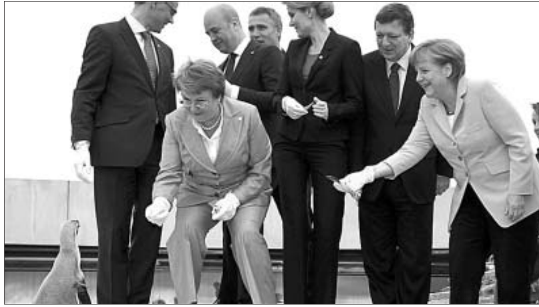
Лідары краін-удзельніц Савета балтыйскіх дзяржаў, якія сабраліся ў нямецкім горадзе Штралінгуэнде, каб абмеркаваць энергетычныя і дэмаграфічныя праблемы, знайшлі час пакарміць пінгвінаў у акеанарыю.