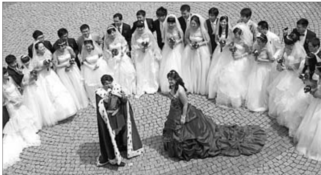
15 кітайскіх пар, якія ажаніліся дома, прыехалі ў нямецкі горад Фюсен на сімвалічную цырымонію ўзяцця шлюбў ў замку караля Баварыі Людвіга II.