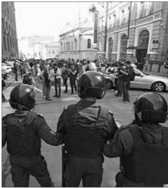
На улицах Москвы...