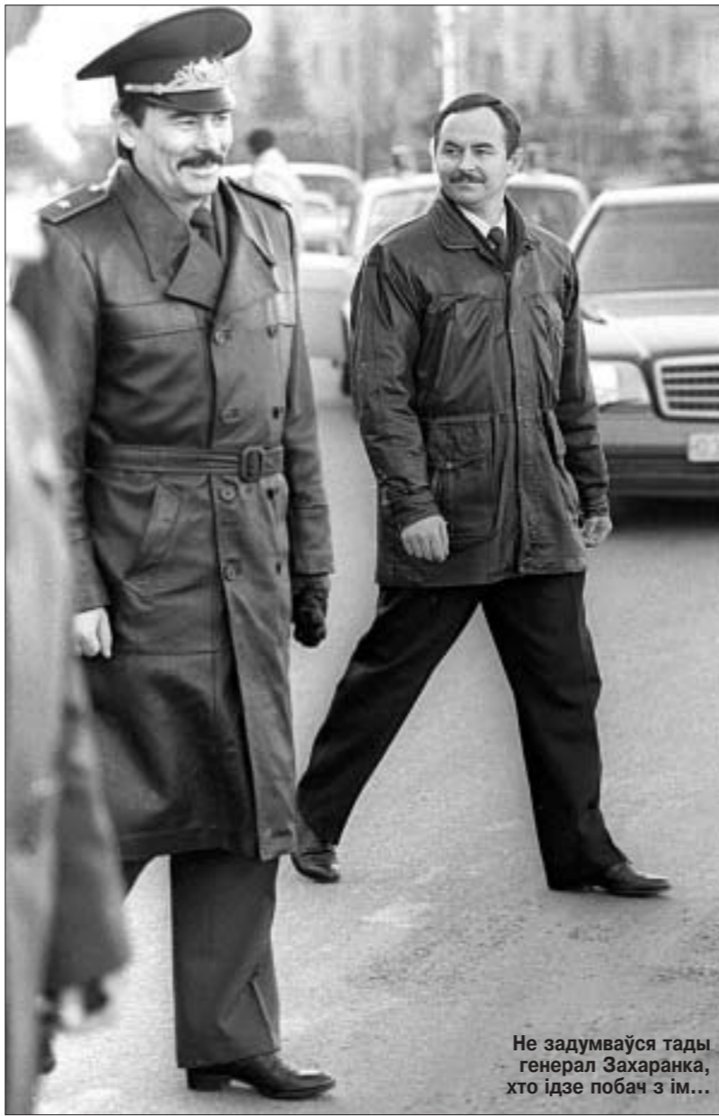
Не задумвайцеся тады генерал Захаранка, хто ідзе побач з ім...