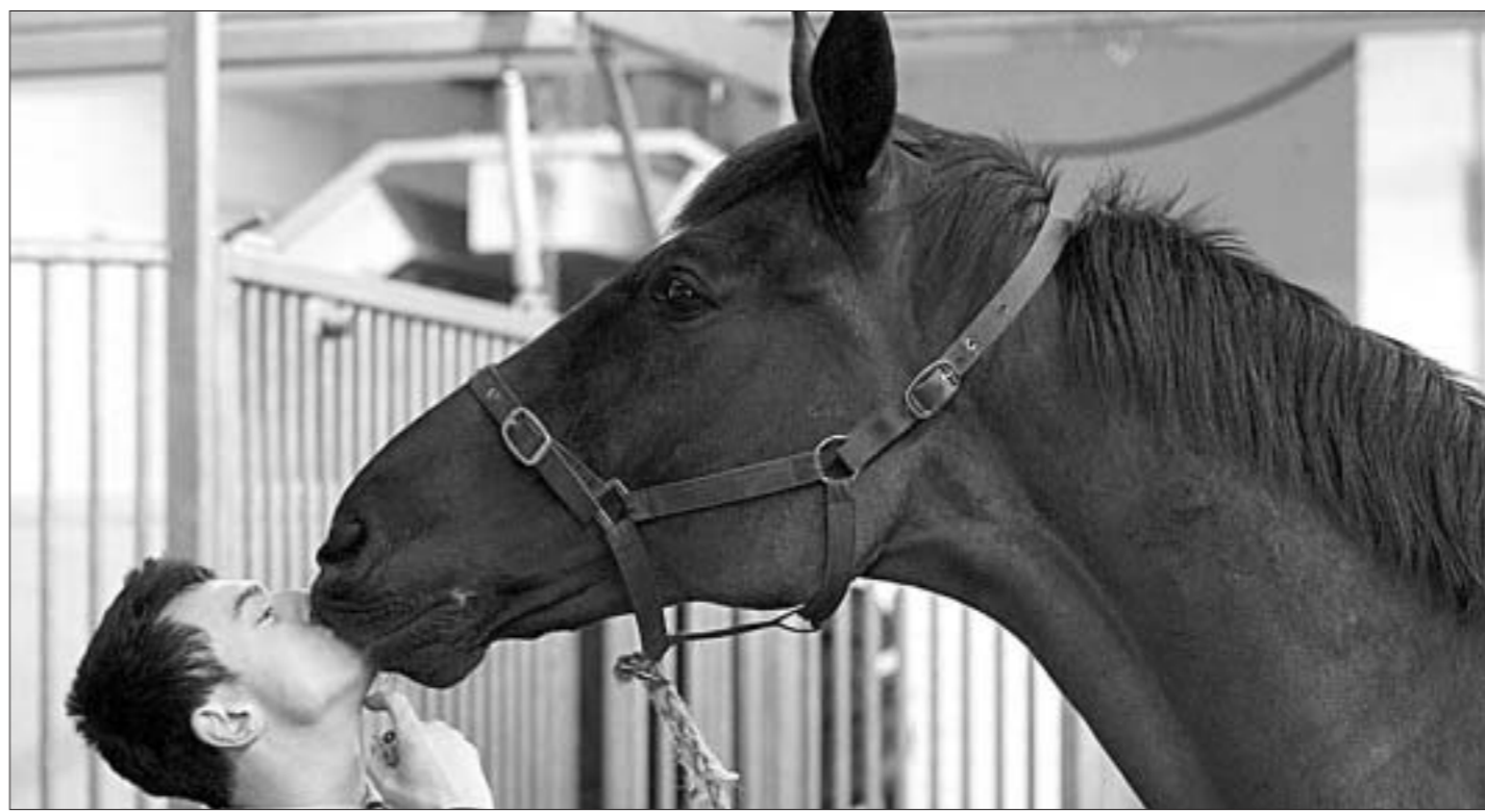
У Лондане Каралеўская конная гвардыя рыхтуецца да святкавання 60-годдзя знаходжання Елізаветы II на прастоле.

Таким образом, Израиль получил возможность участвовать в соревнованиях на уровне национальных сборных и клубных команд в Лиге чемпионов и Лиге Европы. Так что это географическое исключение связано с политическими причинами."