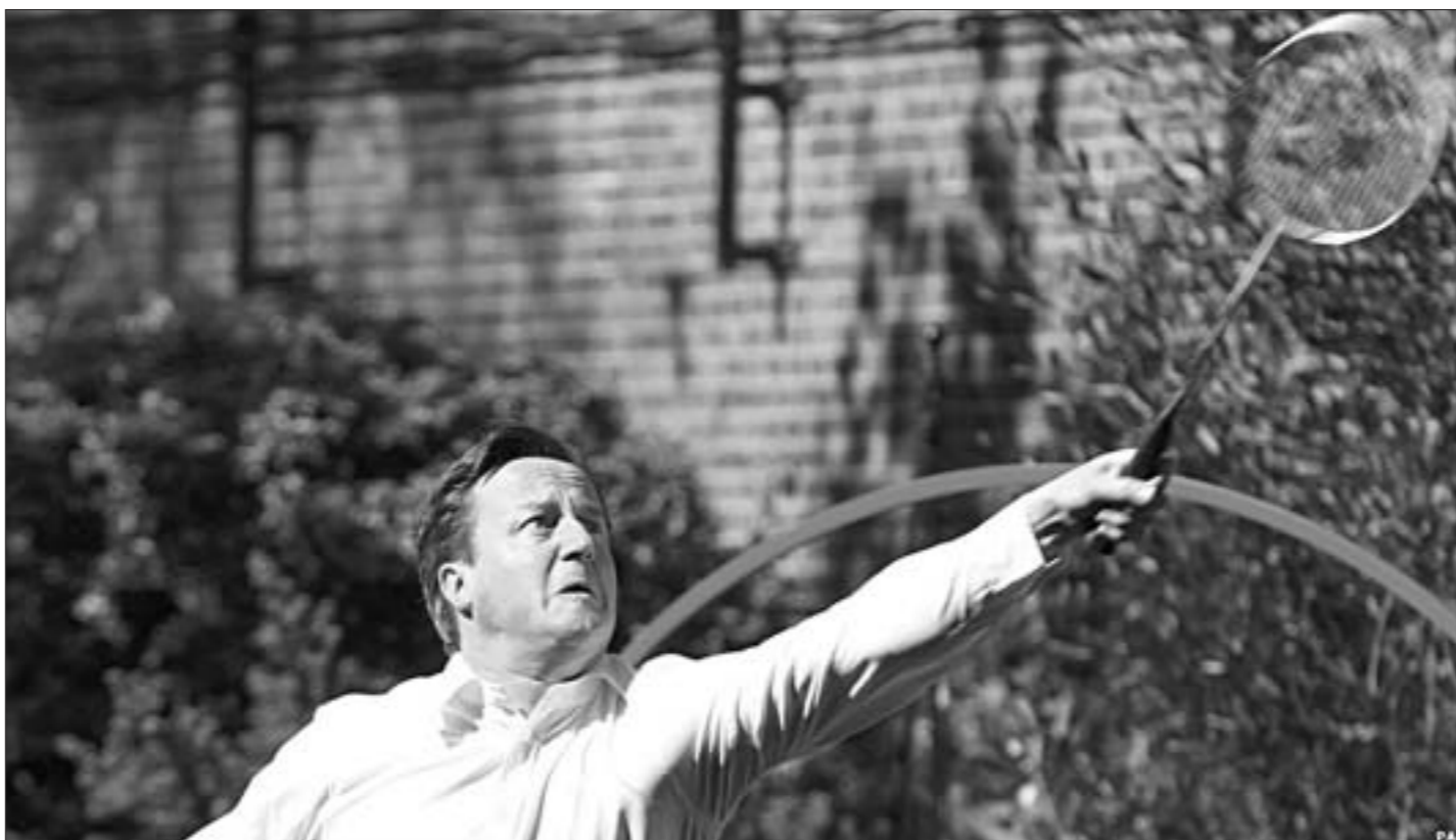
Прем'єр-міністр Вялікабрытаніі Дэвід Кэмерон "рыхтуецца да Алімпіяды" — гуляе ў бадмінтон у садзе Дома ўрада з кіраўніком аркамітэта лонданскай Алімпіяды-2012.

На борту воздушного судна, принадлежавшего авиакомпании "ЮТэйр", находились 39 пассажиров и четыре члена экипажа. Как сообщает авиаперевозчик, АТ-72 разбился под Тюменью после взлета из аэропорта "Рошино" во время выполнения вынужденной посадки.