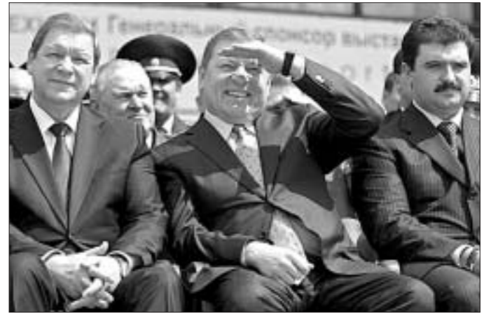
В компании с Виктором Лукашенко и Сергеем Сидорским Юрий Жадобин (в центре) чувствовал себя уверенно.

В минувшую пятницу, 30 марта, министр обороны Беларуси генерал-лейтенант Юрий Жадобин целый час отвечал на телефонные звонки — анонс «прямой линии» с министром накануне разместила газета «Советская Белоруссия».