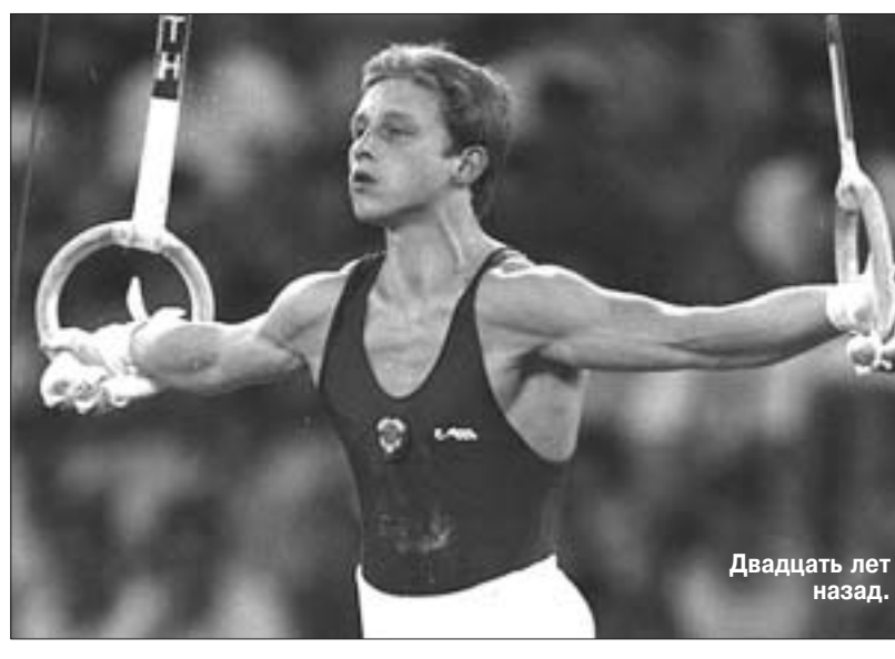
Двадцать лет назад.

— Жизнь только начинается... — За новым домом смотрит домохозяйка? — Нет, это при нынешнем положении очень накладно. Да и настоящая