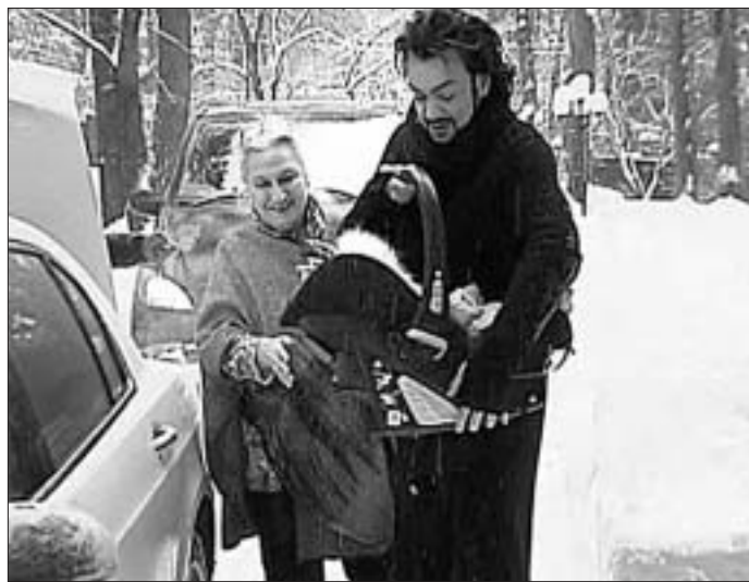
— Суррогатное материнство не должно быть допустимо в принципе!

стать — папой или мамой? От кандидатуры Баскова Киркоров отказался сам.