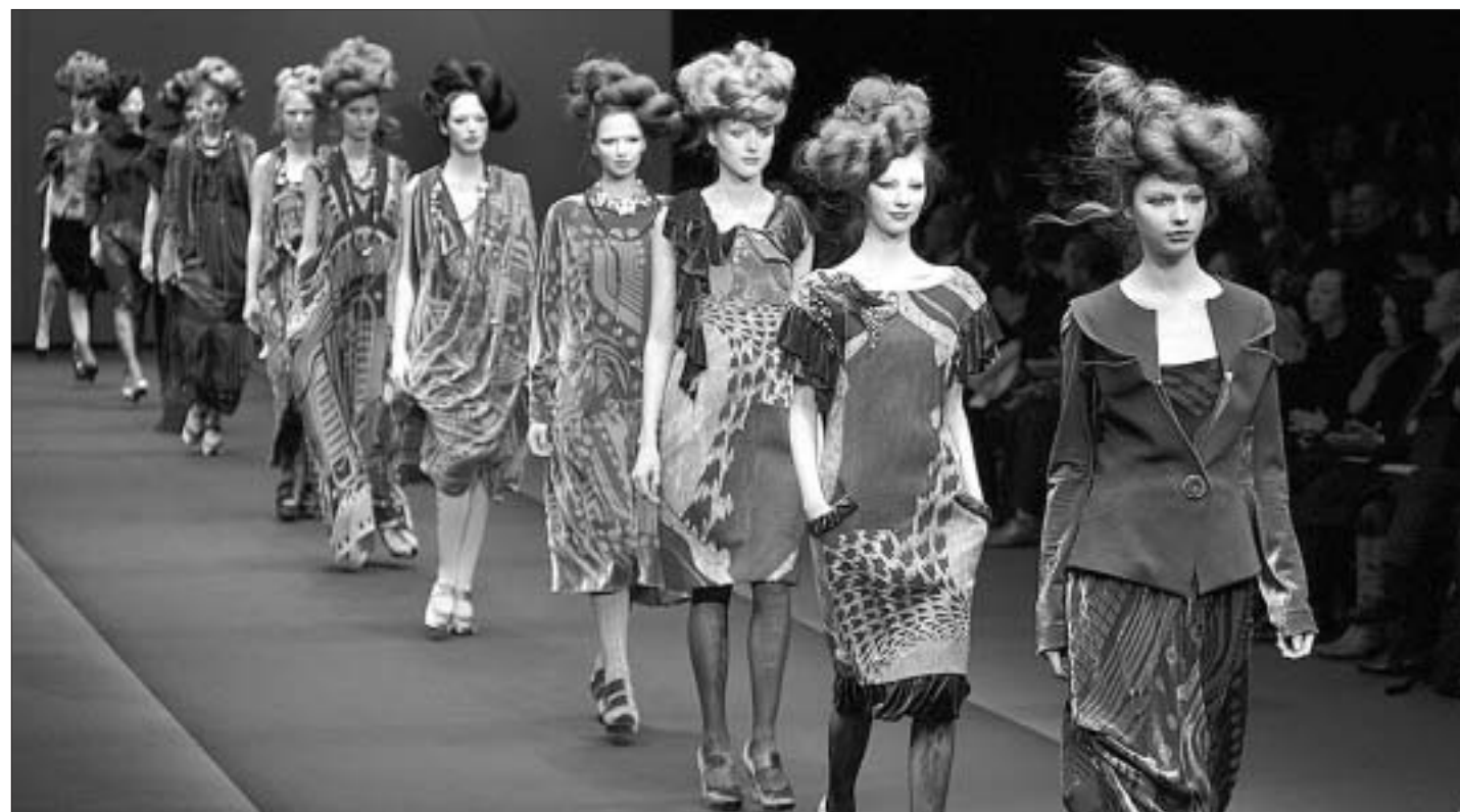
На такіэй подыум выйшлі мадэлі, якія прадстаўляюць калекцыю сезона 2012/13 гадоў мадэльера Хірока Кашына.

В зависимости от структуры и сохранности они продаются музеям, ученым и коллекционерам по цене от 300 до 1 тыс. долларов за 1 грамм. Для сравнения: рыночная стоимость золота сейчас достигает 58 долларов за 1 грамм. При изучении теорит марсианского происхождения может раскрыть важнейшую для ученых информацию о Красной планете. Например, о составе ее атмосферы, особенности климата, вероятности наличия органических веществ и предпосылок для существования воды, а значит, и жизни.