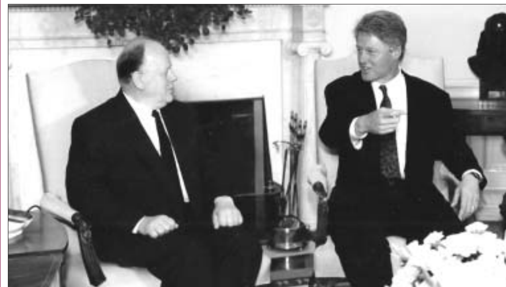
(Начало в №№9—34, 45—48.)