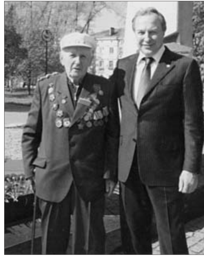
Ветеран Великой Отечественной войны, уроженец Казахстана Ю.Булюбаев и Чрезвычайный и Полномочный Посол Республики Казахстан в Республике Беларусь А.Смирнов на праздновании 9 Мая. (Недавно закончился срок его пребывания в нашей стране.)