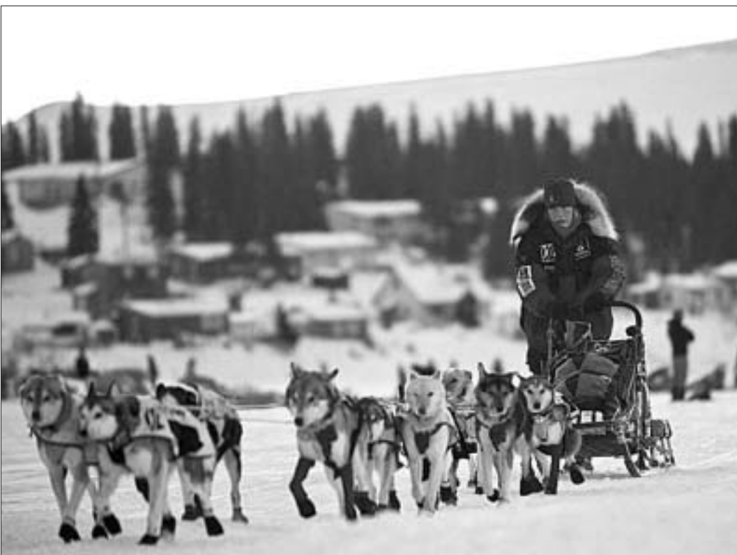
Удзельнік шматдзённай гонкі сабачых запрэжак у штаце Аляска заканчвае чарговы этап.

популярных городов для вложения капиталов. Другие города группы стран БРИК также серьезно «подросли»: Бразилия, Россия, Индия и Китай — все они растут стремительными темпами, тем временем как Европа переживает спад, тяжелый удар кризиса суверенных долгов, сообщает Би-Би-Си. Бразилия недавно стала 6-й экономикой мира по объемам ВВП, перегнав Великобританию, совокупный ВВП составил 2,5 трлн долларов. Сан-Паулу является финансовой столицей этой страны. В 2011 году КНР обошла Японию, заняв второе место в списке. Согласно докладу «Глобальный мониторинг инвестиций в города», на первую «пятерку» рейтинга — Лондон, Шанхай, Гонконг, Сан-Паулу, Нью-Йорк — приходится 50% глобальных инвестиций в 22 ведущих мегаполисах.