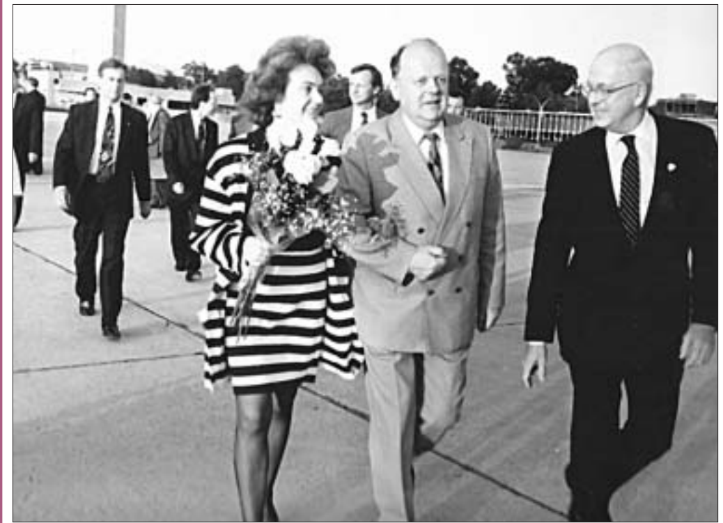
(Начало в №№9—34.)