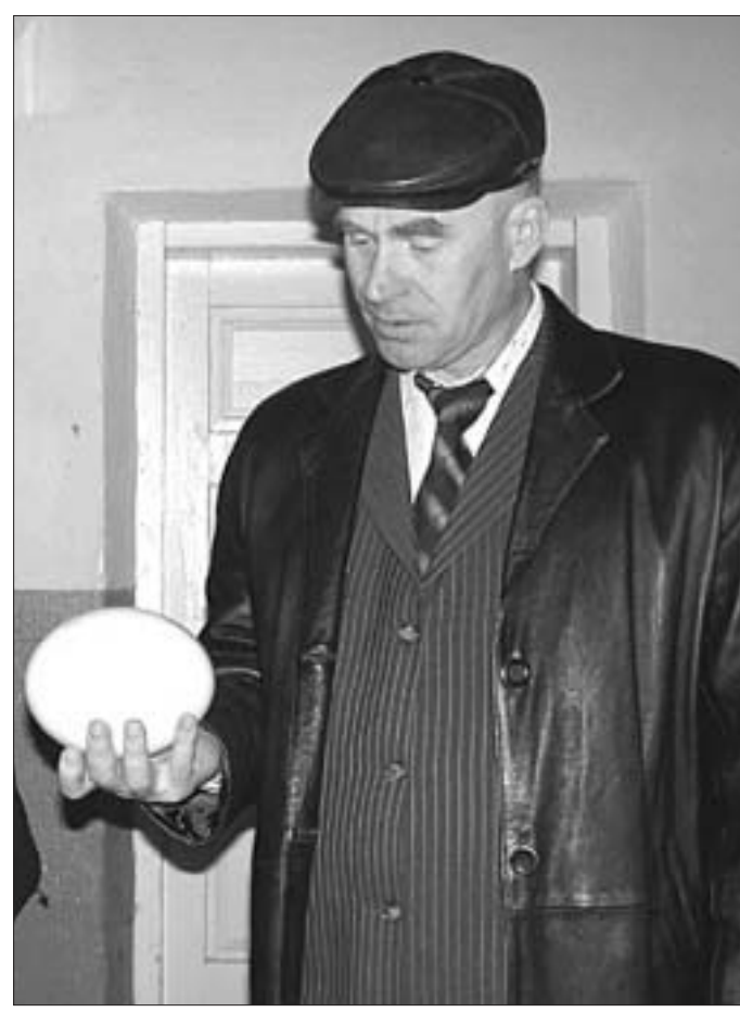
Георгій ПЛАТОНАЎ.