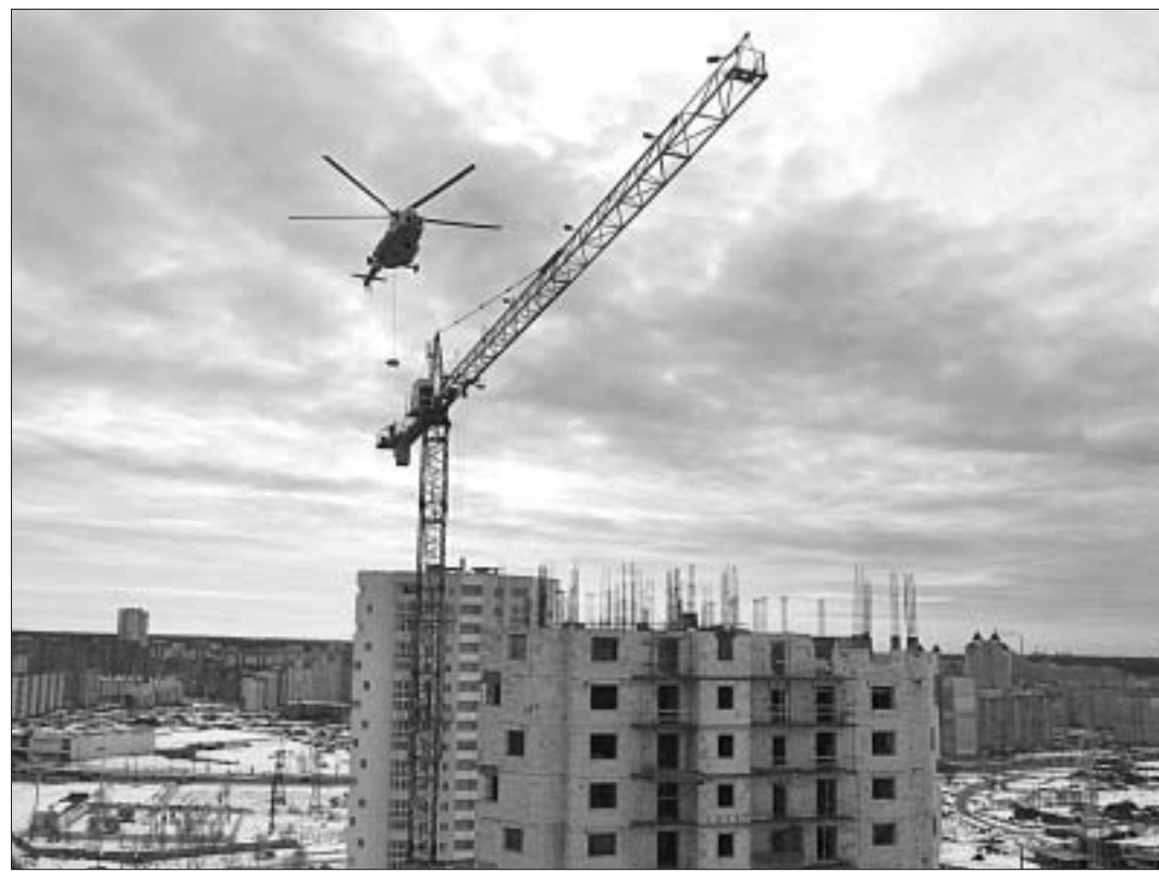
Вертолет белорусского МЧС помогает строителям многоэтажного дома заменить неисправный электромотор строительного крана на новый. Минск, март 2012 года.