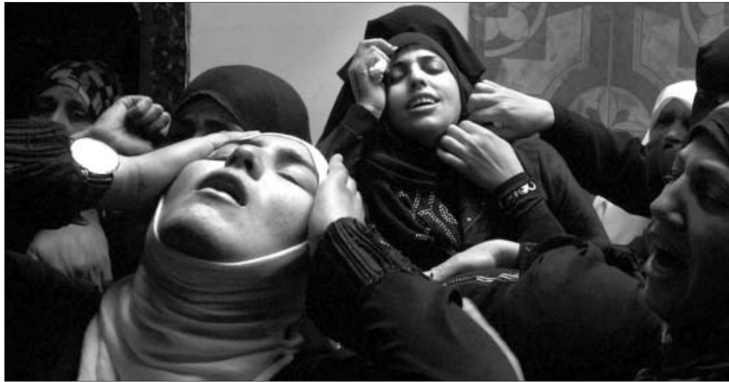
На пахаванні ў Газе родзічы аплакаваюць палесцінца, які загінуў у выніку ізраільскага авіяудару.