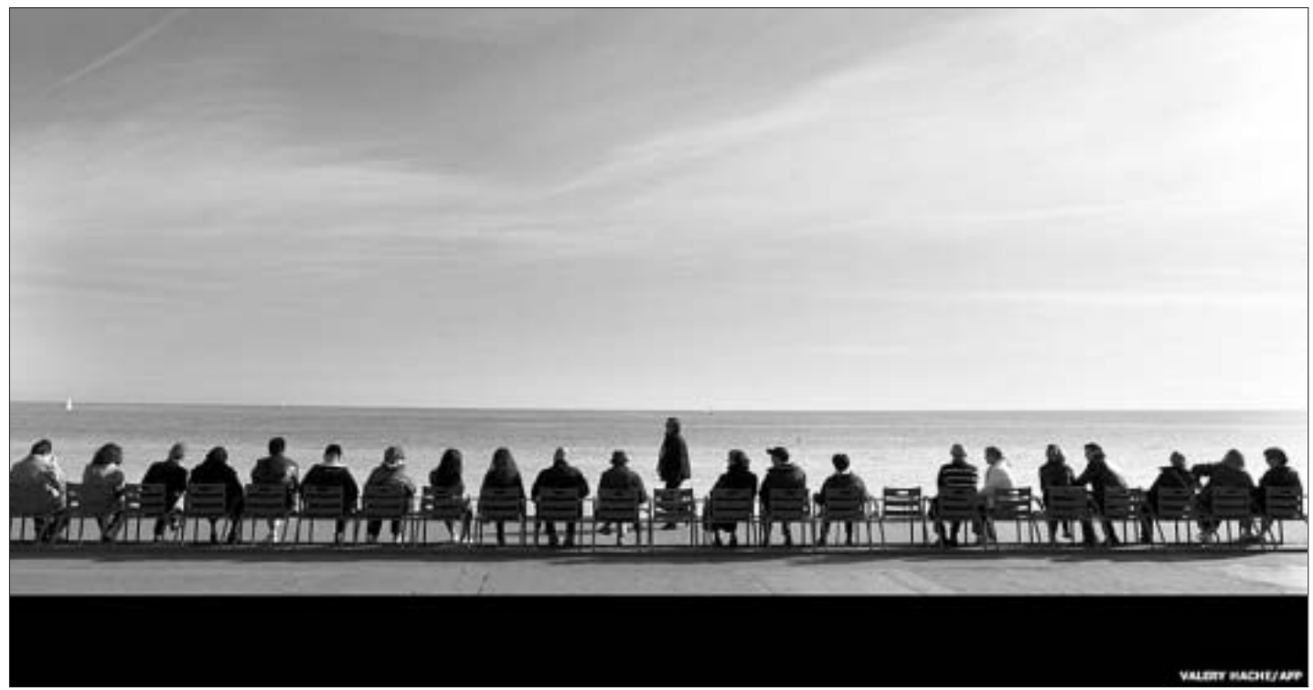
Купацца яшчэ рана, а вось пагрэцца на сонейку на набярэжнай Ніццы на поўдні Францыі ўжо можна, што і робяць гараджане і адпачываючыя.