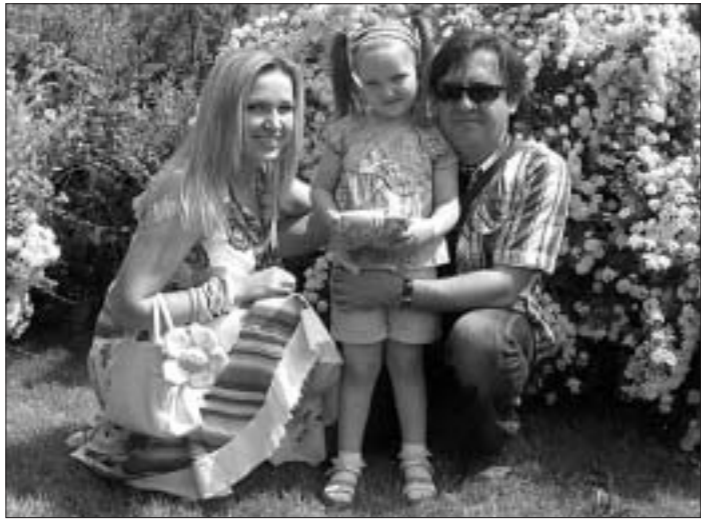
— В наших магазинах особенно-то и не экономим... — Это уж точно: хотелось бы выбраться за покупками в страны Балтии или Польшу, там многие вещи дешевле, но все никак не получается. — Вы, как и многие семьи,