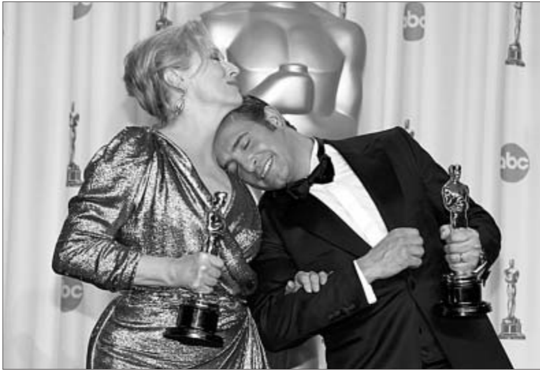
Так урчали "Оскары", и так радовался тыя, хто іх атрымаў.