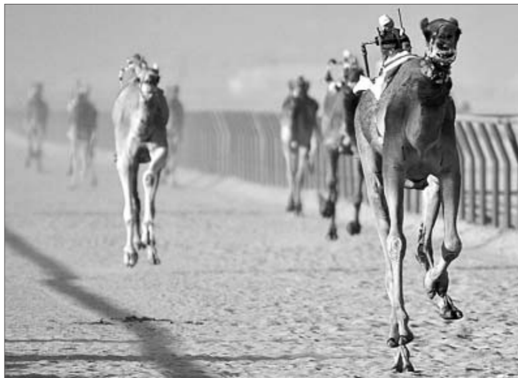
Гонки вярблюдў у Кувейце. Замест жакейў на іх спінах робаты, якімі дыстанцыённа кіруюць гаспадары жывёл, суправаджаючы гонку на машинах.

И Херману ван Ромпею удаётся прекрасно уравновесить все эти многочисленные центры тяжести. Пусть и не выходя на первый план, он как бы в фоновом режиме обеспечивает эту преемственность, своего рода координацию между главами государств и правительств, не отвоюявая у них места под софитами телевидения и всплывшими фотографиями прессы, в особенности, конечно, при подготовке европейских саммитов и в разработке их финальных решений".