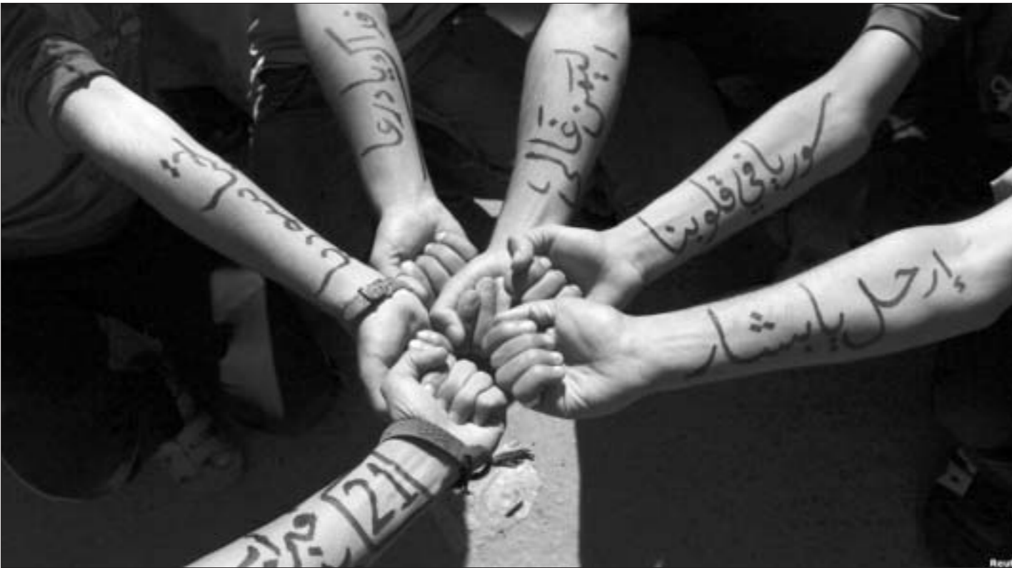
У сталіцы Емена прайшла дэманстрацыя ў падтрымку сірэйскай апазіцыі. На руках гэтых людзей напісана "Жыве Сірыя!", "Сірыя ў нашых сэрцах", "Башар, бывай!"