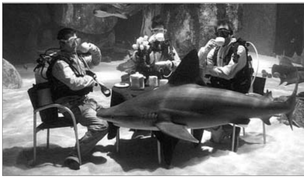
Супрацоўнікі лонданскага заапарка п'юць чай у акварыуме для акул, каб прадеманстраваць, што яны даволі міралюбівыя рыбы.