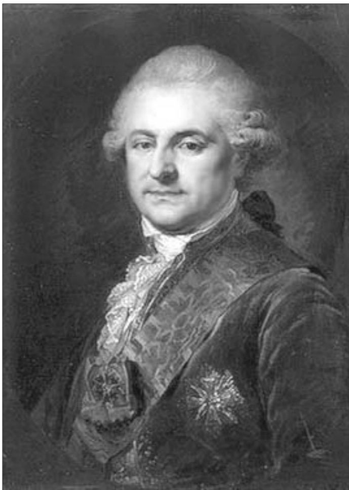
свой плён. Віват каралю!..

Незалежнасць беларуска-літоўскай дзяржавы (ВКЛ) і Польшчы была канчаткова зліквідавана Расіяй, Прусіяй і Аўстрыяй: беларуска-літоўскае гаспадарства прымушова далучылі да Расійскай імперыі, а Польшчу падзялілі паміж Прусіяй і Аўстрыяй... Кароль пасля смерці Кацярыны II (у лістападзе 1796 г.) быў выкліканы яе пераемнікам Паўлам I у Санкт-Пецярбург. Там яго зольшлага ўсцешылі — захавалі тытул караля (натуральна, без дзяржавы) і далі невялікі двор. 12 лютага 1798 года апошні кароль і вялікі князь Станіслаў Аўгуст аддаў Богу душу, пакінуўшы не толькі фінансавы даўгі, але і вялікую загадку для гісторыкаў. Тая загадка і па сёння да канца не разгадана, бо для польскіх даследчыкаў яна бачыцца ў адным кантэксце, для беларускіх — у другім, а для расійскіх — у трэцім... Усе разам так і не сфармулявалі, кім жа быў на самай справе Станіслаў Аўгуст Панятоўскі — няўдалым рэфарматарам, марыянеткай у руках расійскай імператрыцы, самастойным манархам, здраднікам ці проста ўмелым дыпламатам, выпадкова ўзнёсеным на каралеўскі трон?..