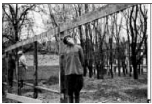
В 1941 году такое я видел на Комаровке и в центре Минска.

Геноцид. Холокост. В последние десятилетия коммунистического властвования в СССР, когда вспоминали о потерях в войне, часто можно было слышать: