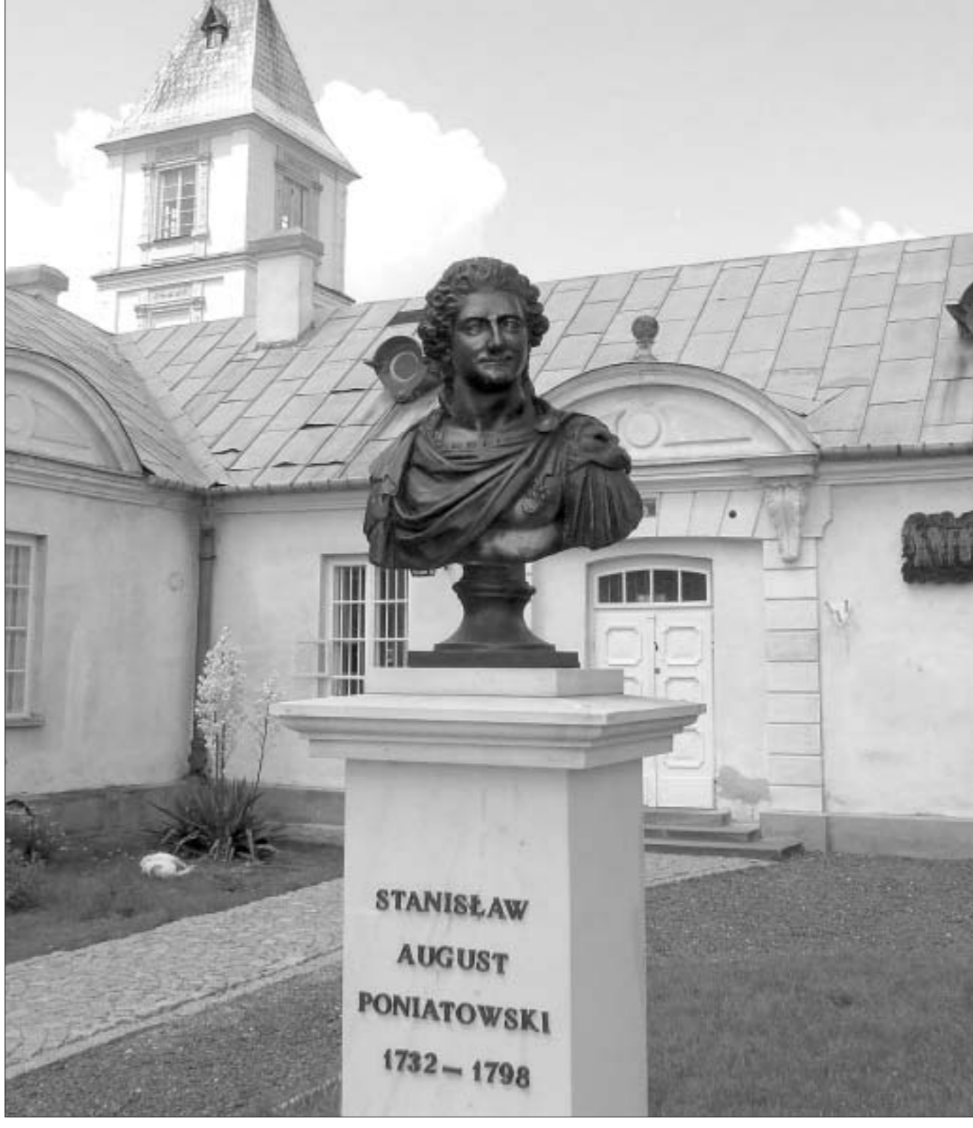
STANISŁAW AUGUST PONIATOWSKI 1732 — 1798

Тым часам у Рэчы Паспалітай паміж магнатскімі групоўкамі Чартарыйскіх і Патоцкіх ішла барацьба за трон... Групоўка Чартарыйскіх, зыходзячы з пажаданняў Кацярыны II, вылучыла на караля кандыдатуру свайго пляменніка — Станіслава Аўгуста Панятоўскага. Па просьбе князя Чартарыйскага імператрыца паслала ў Рэч Паспалітай паслапа ў 1763 г. Кацярына II паставіла пытанне аб далучэнні да Расіі ўсходняй і паўночнай частак Беларусі і ўсходняй тэрыторыі Латвіі.