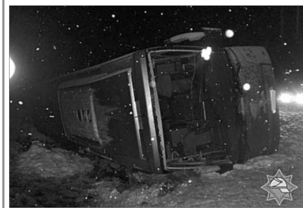
Каб выцягнуць і паставіць на колы аўтобус, які трапіў у ДТЗ у Мінскім раёне, спатрэбілася дапамога 25-тоннага крана.

У Шчучынскім раёне перакульлі маршруты аўтобус з пасажырамі, які ахвіццяўляў рэйс Сморгонь—Гродна. У бальніцу з пераломамі ключыцы і рэбраў дастаўлены адзін з пяці пасажыраў.