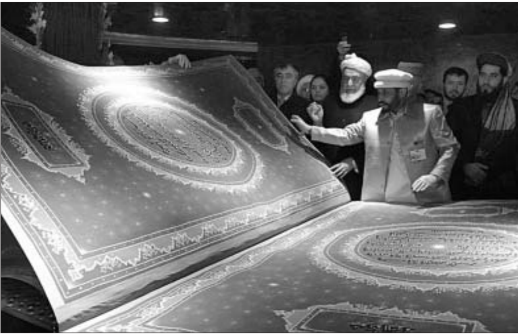
Афганский мастик и яго вучні прадстаўляюць вялізную старонку Карана ў час адкрыцця новай бібліятэкі ў Кабуле.