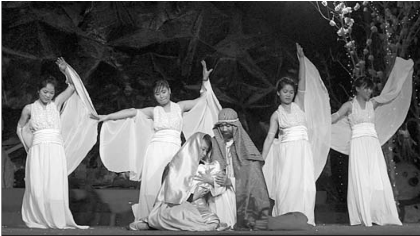
В Таиланде оно было достаточно традиционным.