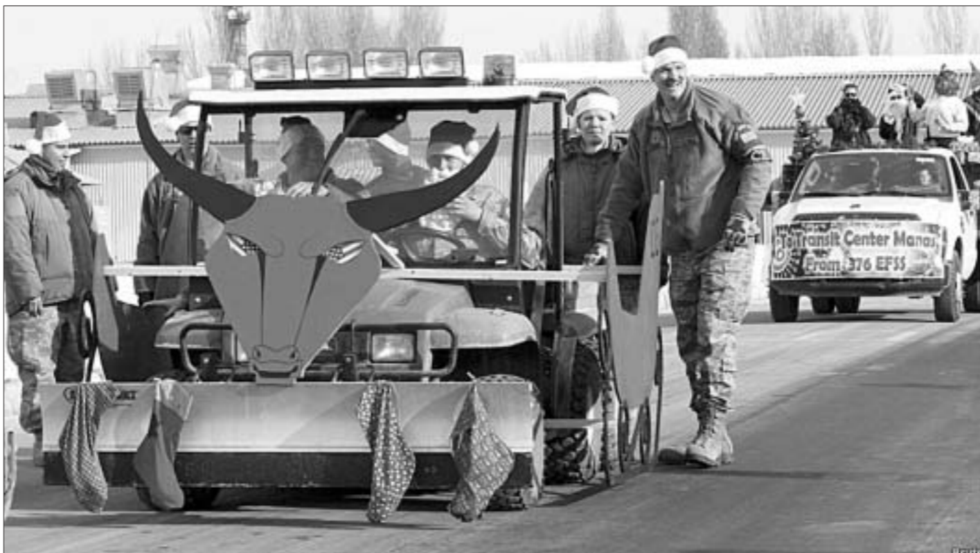
На базе Манас в Кыргызстане американские военные организовали рождественский парад.