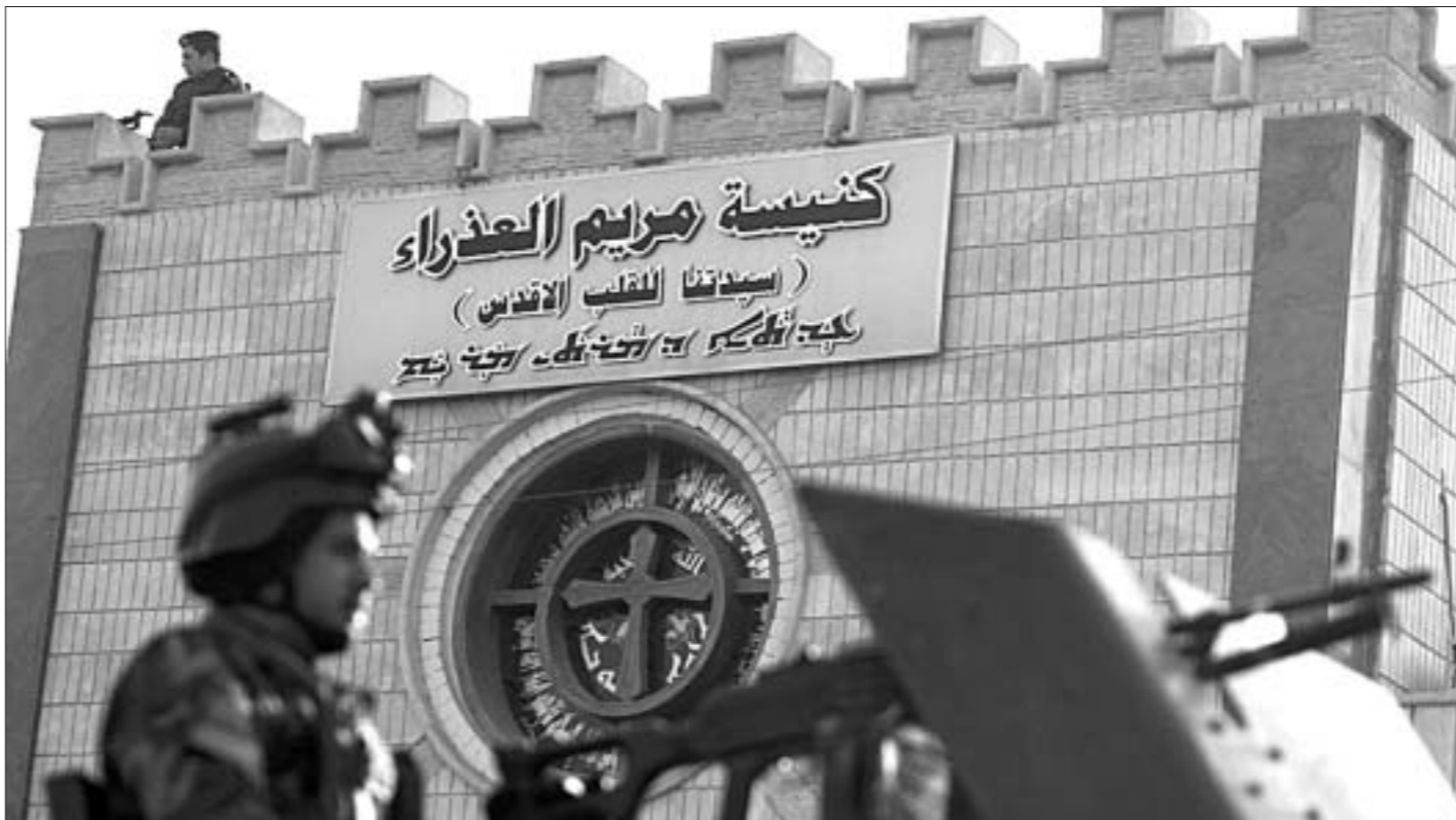
В Багдаде в эти дни церкви охраняли местные силы безопасности на случай нападения боевиков.

Александр Лукашенко выразил соболезнования в связи со смертью северокорейского лидера Ким Чен Ира, но забыл направить слова поддержки чешскому народу в связи со смертью авторитетнейшего европейского политика, бывшего президента Чехии Вацлава Гавела. Каждый, конечно, вправе сам выбирать себе компанию и политические ориентиры, но мы решили все-таки опубликовать рассказ очевидца о том, до какого состояния довел свою страну диктатор, о смерти которого скорбит белорусский вождь. Публикуем рассказ Андрея Илларионова, бывшего помощника президента России, о визите в эту страну российской делегации в июле 2000 года.