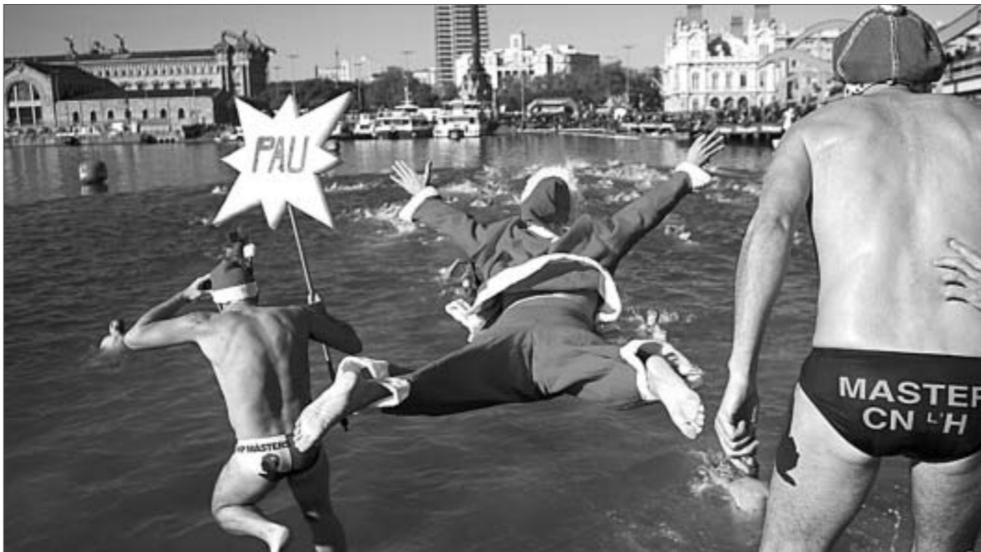
В Барселоне прошел традиционный рождественский заплыв с участием Санта-Клауса.