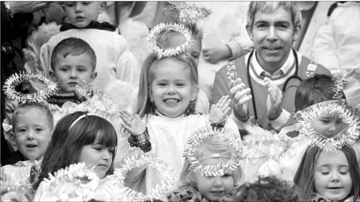
Лорд-мэр Дублина каждый год перед Калядами ездит на дзятых садках і спявае з дзецьмі калядкі.