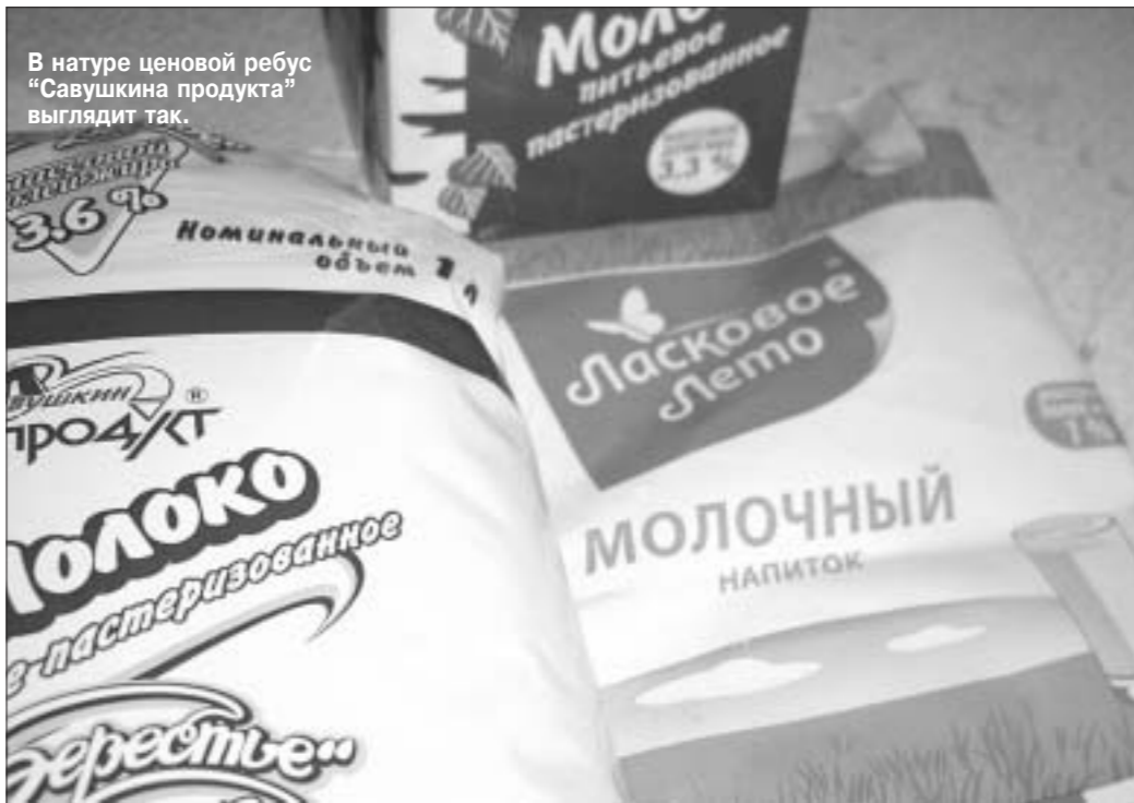
В натуре ценовой ребус "Савушкина продукта" выглядит так.

Постановлениями №№495 и 676, вышедшими в апреле-мае, правительство Беларуси утвердило, а затем расширило перечень социально значимых продуктов питания, куда традиционно вошло пастеризованное коровье молоко жирностью до 3,5%. Однако, как пояснили корреспонденту "Народной Воли" в управлении ценовой политики Брестского облисполкома, вслед за правительственными постановлениями вышло постановление Министерства экономики, которое наделено Совмином полномочиями утверждать предельные отпускные цены производителей и торговые надбавки торговцев. Так вот в апрельском постановлении Минэкономки (№66 от 27.04.2011 г.) вдруг ни с того ни с сего возникли уже новые рамки жирности социально значимого молока — от 1,5% до 3,5%!